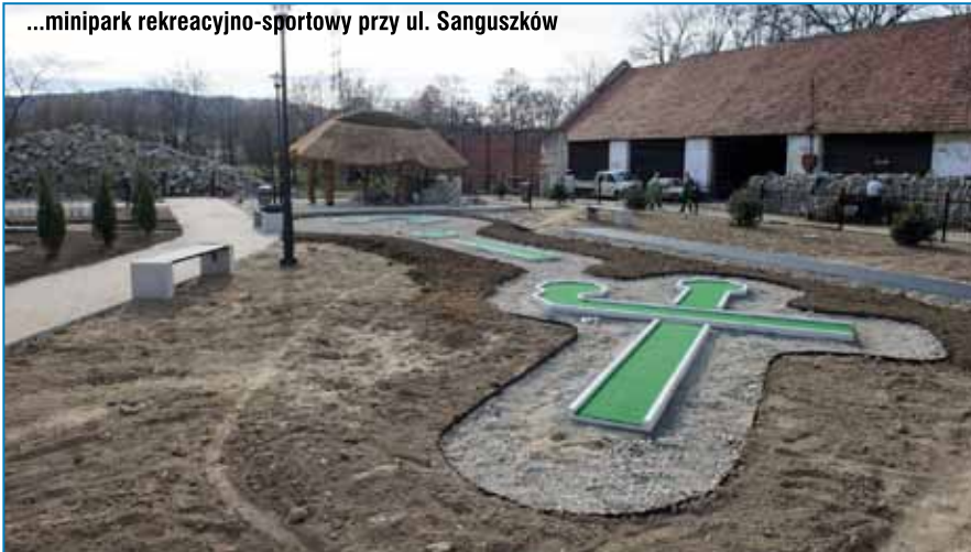
...minipark rekreacyjno-sportowy przy ul. Sanguszków