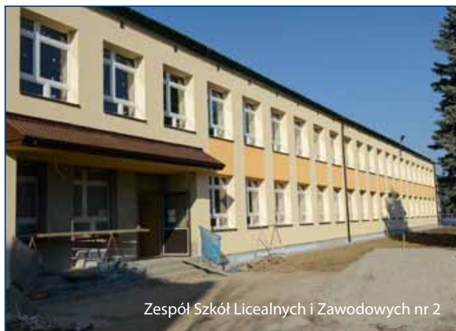
Zespół Szkół Licealnych i Zawodowych nr 2