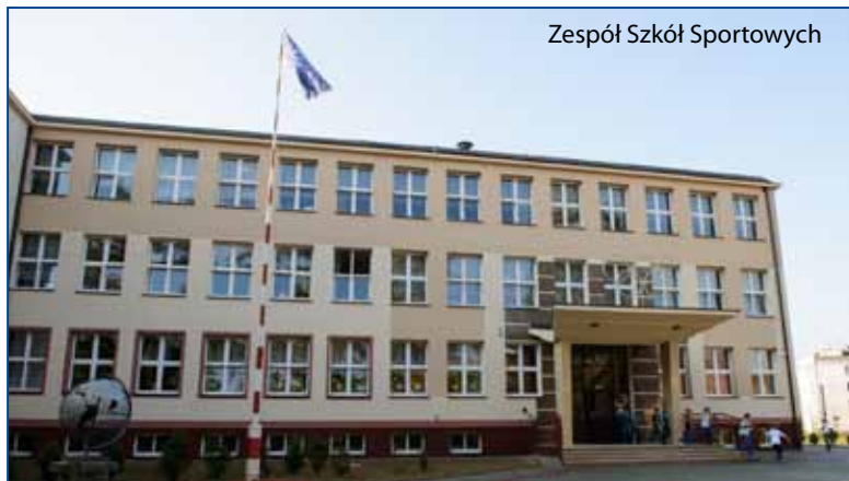
Zespół Szkół Sportowych

Dobiegają końca zaplanowane na ten rok prace termomodernizacyjne w tarnowskich placówkach oświatowych. To ostatni etap dużego miejskiego programu, którego celem jest podniesienie estetyki i funkcjonalności żłobków, szkół, przedszkoli i domów pomocy społecznej.