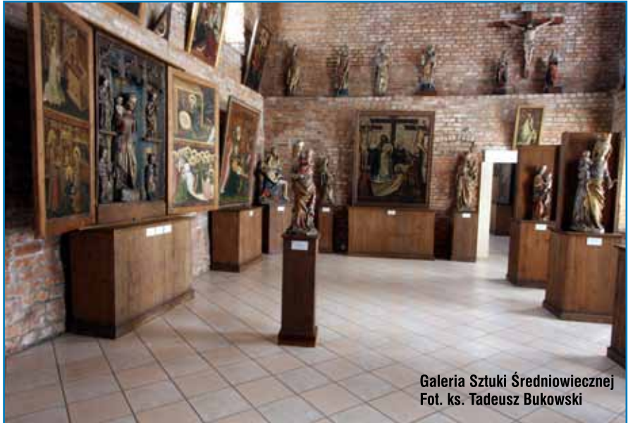
Galeria Sztuki Średniowiecznej

Tarnowskie Muzeum posiada także dział sztuki ludowej, gdzie na szczególną uwagę zasługują obrazy ludowe malowa-