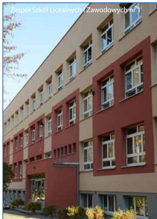
Zespół Szkół Licealnych i Zawodowych nr 1

Termomodernizacja możliwa jest dzięki dofinansowaniu i preferencyjnej pożyczce otrzymanej z Narodowego Funduszu Ochrony Środowiska i Gospodarki Wodnej oraz dofinansowaniu z Małopolskiego Regionalnego Programu Operacyjnego. Jej koszt w tym roku to prawie sześć mln zł. W sumie termomodernizacja obiektów oświatowych w latach 2010-13 objęła ponad 40 placówek (1 dom dziecka, 2 domy pomocy społecznej, 5 żłobków, 11 przedszkoli oraz 22 szkoły). Kosztowała prawie 29 mln zł.