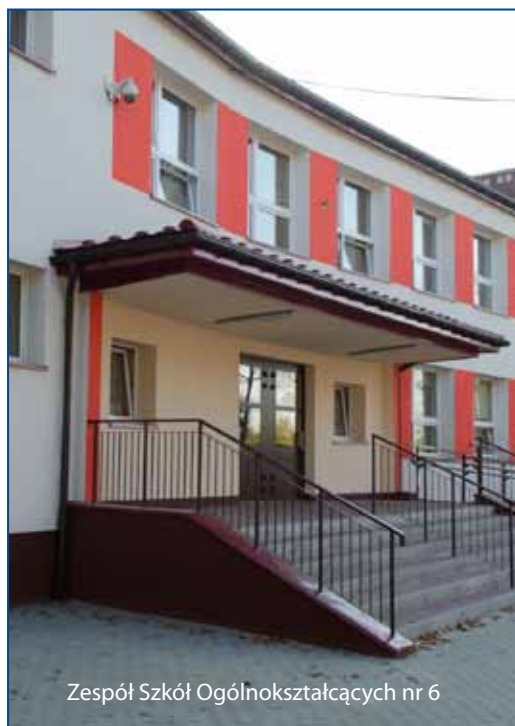
Zespół Szkół Ogólnokształcących nr 6