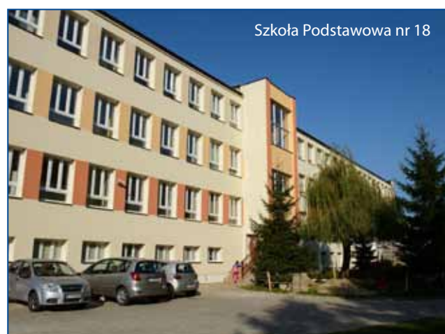
Szkoła Podstawowa nr 18