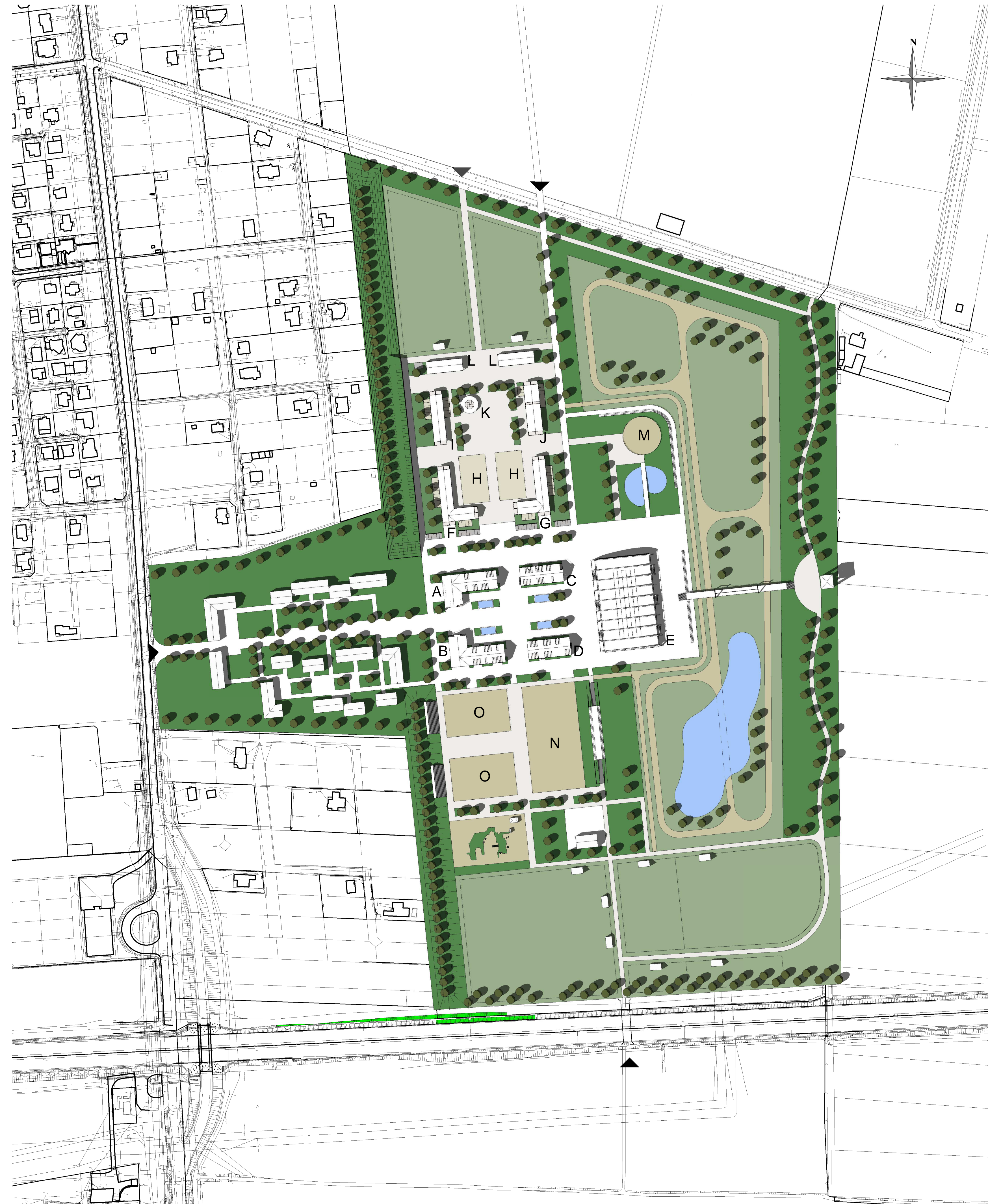
1 Zagospodarowanie terenu 1 : 2000