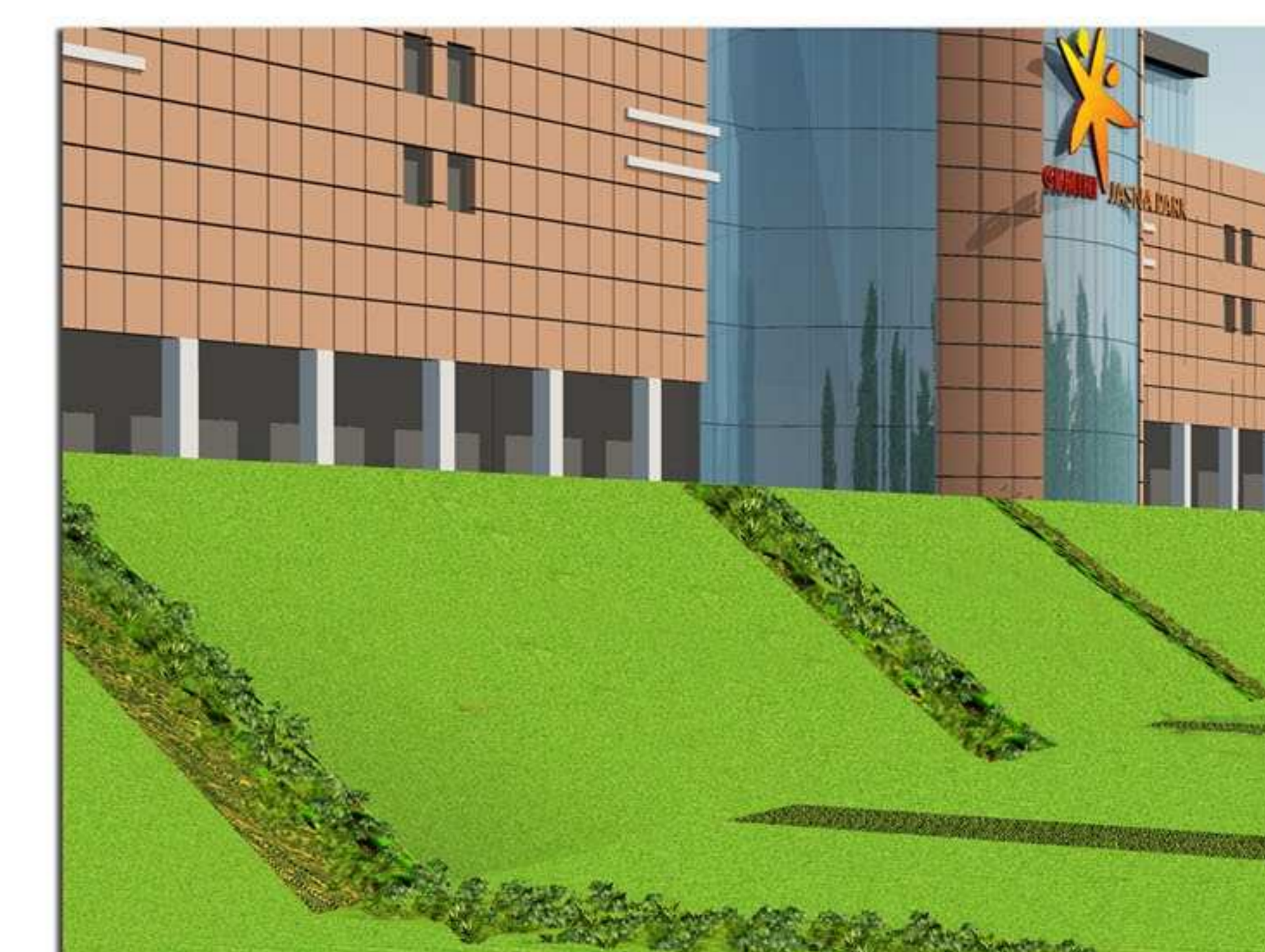
Widok fragmentu skarpy w wersji 2 - naprzemienne pasy roślinności okrywowej