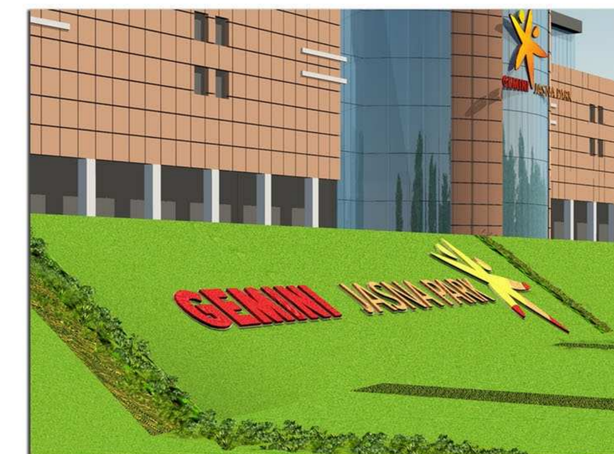
Widok fragmentu skarpy w wersji 1 - logo Galerii wykonane w tworzywie roślinnym