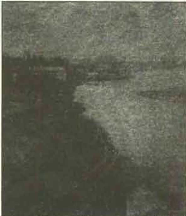
Linia obronna na rzece Dunajec - okolice Tarnowa

W początku ubiegłego (XX) wieku krążyła po Tarnowie i okolicy legenda, iż Polska dotąd nie odzyska niepodległości, dopóki wody Dunajca u stóp góry św. Marcina nie zaczerwieni się od krwi. Przepowiadano w ten sposób, jakieś straszne, mające wkrótce nadejść wojenne kataklizmy, kończące się jednak radosnym, długo oczekiwanym dniem, w którym Polska odzyska pełną niepodległość. Pierwsza większa bitwa I Brygady Legionów Polskich stoczona została pod Tarnowem, tuż za górą św. Marcina pod Łowczówkiem, w Wigilię i Boże Narodzenie 1914 r. To wtedy właśnie wody Dunajca miały się zaczerwienić od krwi, gdy przez tę rzekę przewożono rannych.