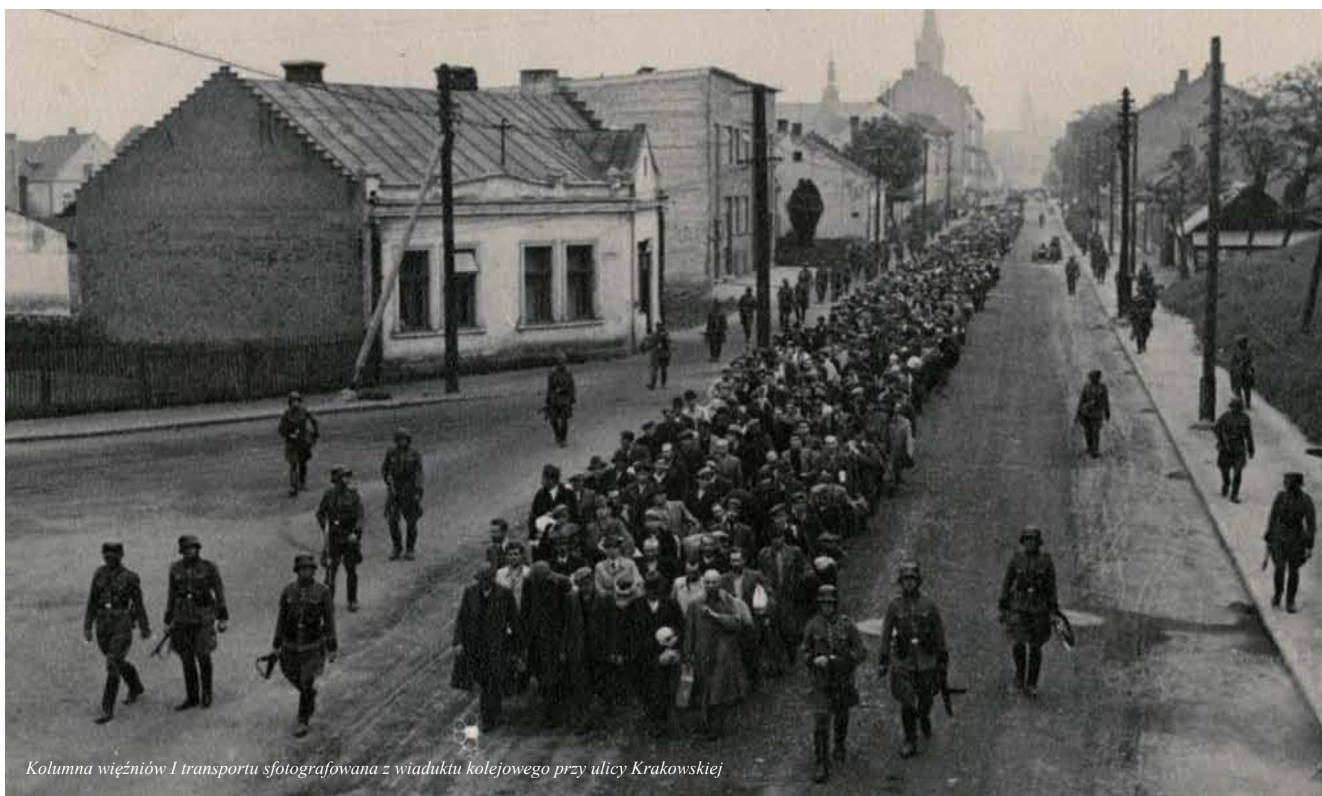
Kolumna więźniów I transportu sfotografowana z wiaduktu kolejowego przy ulicy Krakowskiej

„Więźniowie Auschwitz przetrwali”, a my młodzi, uczniowie szkół Tarnowa i Oświęcimia niesiemy pamięć o milionie zgładzonych istnień ludzkich z całego świata. Słuchamy głosu Ocalałych, mówimy o zbrodniach w Auschwitz, o walce z obojętnością, nietolerancją i antysemityzmem, o poszanowaniu różnic i szukaniu podobieństw. Podtrzymujemy pamięć o tamtych wydarzeniach, gdy odchodzą już ostatni świadkowie historii.