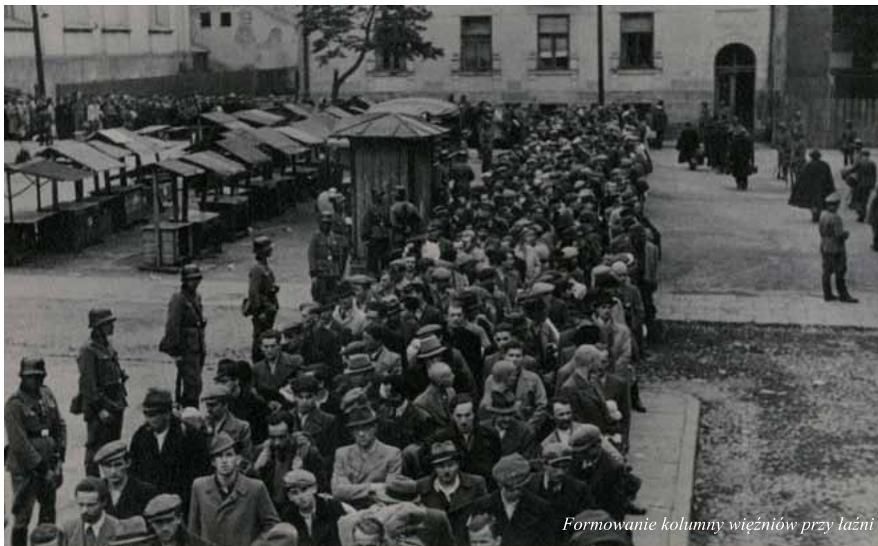
Formowanie kolumny więźniów przy łaźni