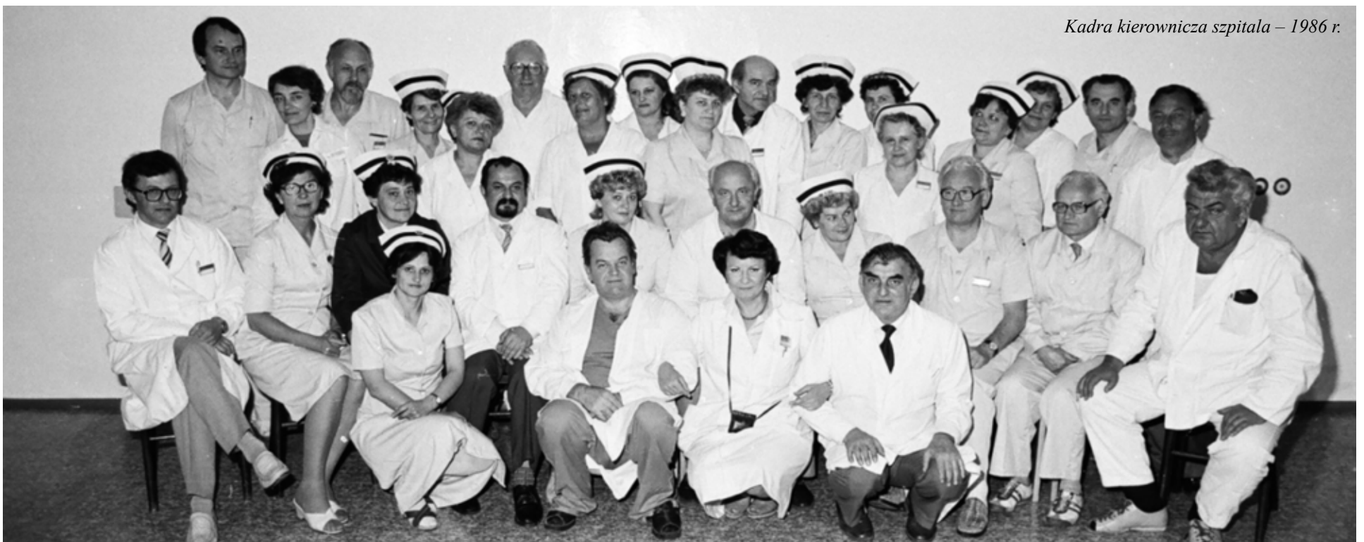
Kadra kierownicza szpitala – 1986 r.

W latach 60-tych szpital rozpoczął działalność dydaktyczno-naukową, stwarzając możliwość uzyskania specjalizacji lekarzy w podsta-