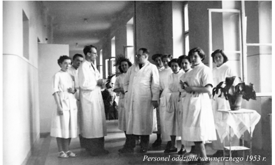
Personel oddziału wewnętrznego 1953 r.