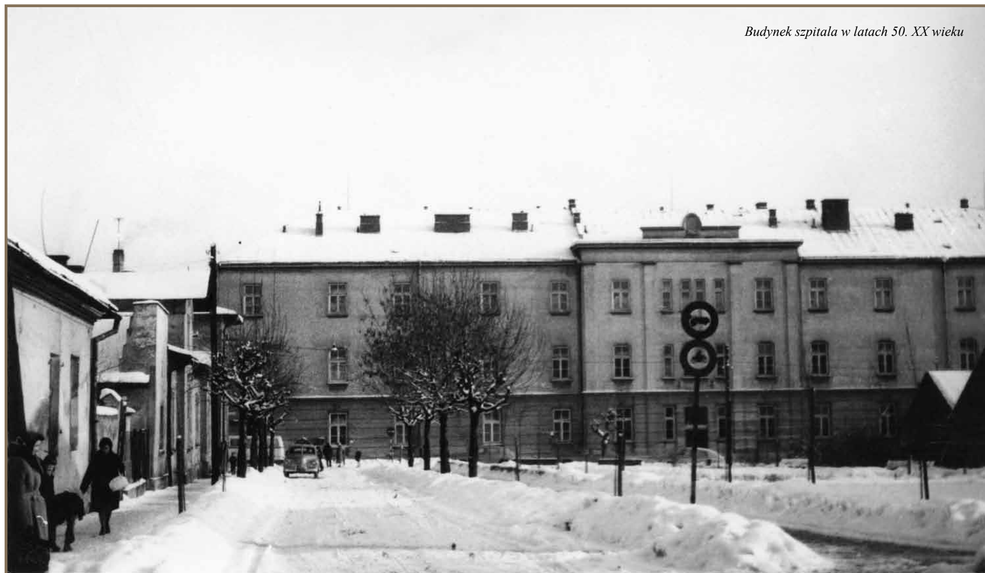
Budynek szpitala w latach 50. XX wieku

Niewiele jest szpitali w Polsce, które mogą szczycić się 180-letnią historią działalności. To okres, w którym w medycynie zmieniło się prawie wszystko – od sposobów leczenia, poprzez postęp wiedzy specjalistycznej, rozwój technologii medycznych, technik operacyjnych itd.