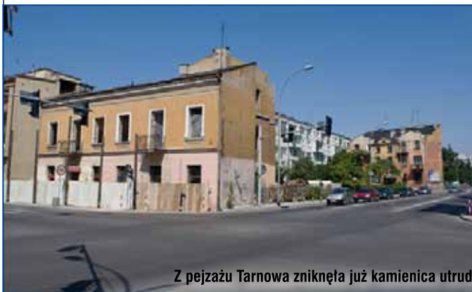
Z pejzażu Tarnowa zniknęła już kamienica utrudniająca ruch pojazdów w centrum miasta