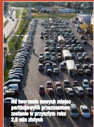
Na tworzenie nowych miejsc parkingowych przeznaczone zostanie w przyszłym roku 2,5 mln złotych