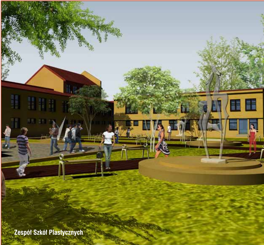
Zespół Szkół Plastycznych

złotych, wykonane zostaną według czytelnych i jasnych kryteriów, a ich program konsultowany będzie z radnymi.