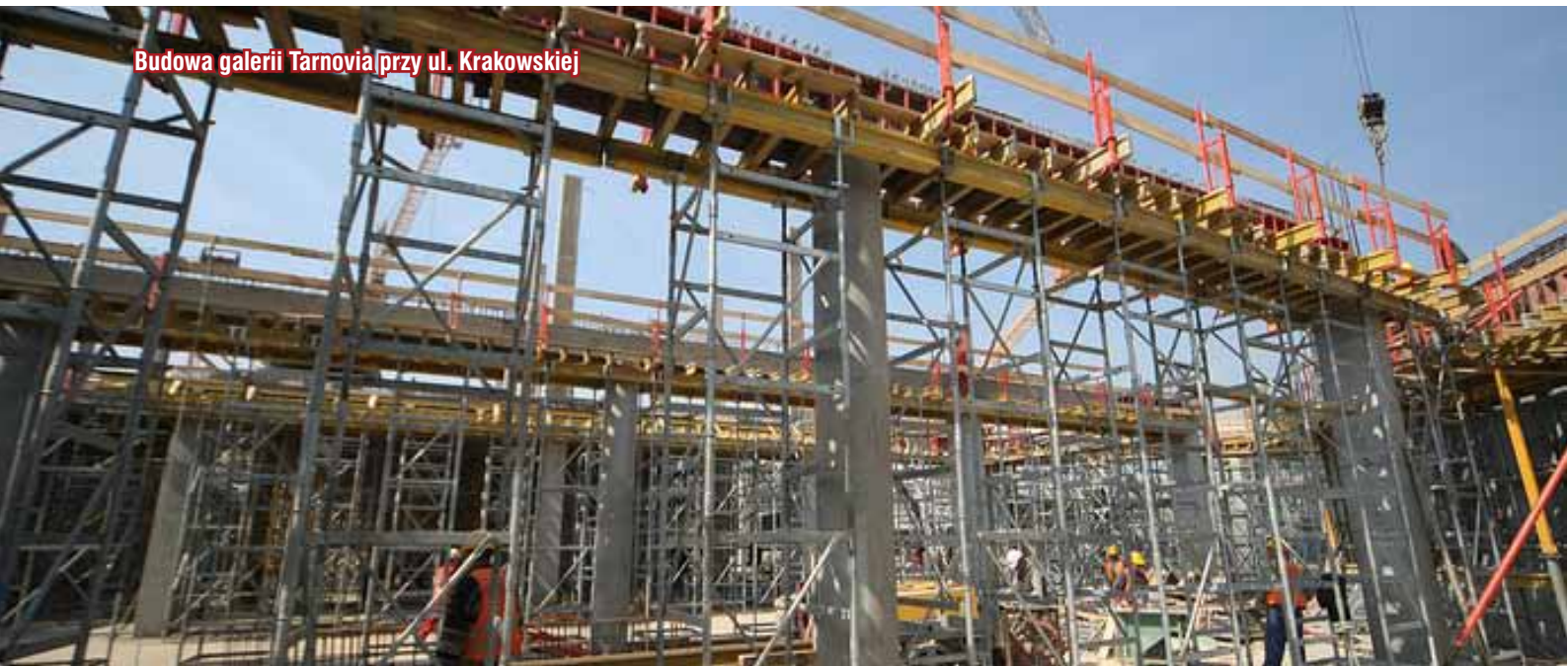
Budowa galerii Tarnovia przy ul. Krakowskiej