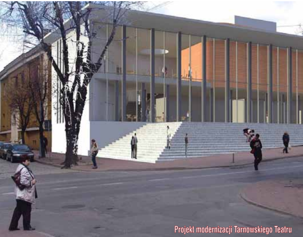
Projekt modernizacji Tarnowskiego Teatru

Miejskie inwestycje drogowe wspierane są przez fundusze zewnętrzne. Z tych źródeł pozyskane zostanie łącznie 13 mln euro.