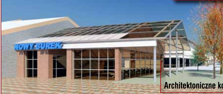
Architektoniczne koncepcje zagospodarowania placu

Na placu Łaziennym mogłaby stanąć nowoczesna hala targowa, dająca także możliwość prowadzenia handlu „z ręki”. Zmodernizowany tarnowski „Burek” byłby ważnym elementem prowadzonych