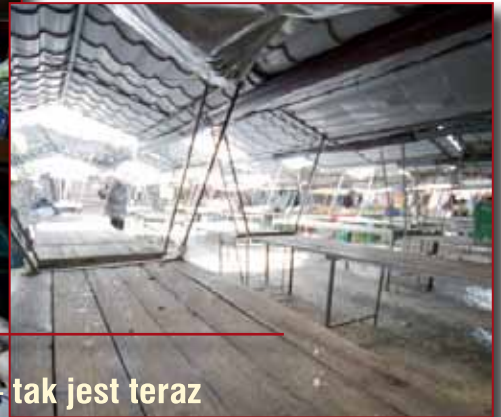
Burek – tak jest teraz

C zy tarnowski „Burek” powinien być reprezentacyjnym placem miasta? Czy przesunięcie handlu na sąsiadujący z nim plac Łazienny zaakceptują sprzedający i kupujący? By poznać opinie tarnowian Targowiska Miejskie zleciły przeprowadzenie badań opinii publicznej. Ankieterzy warszawskiej firmy Homo Homini pytali mieszkańców, jakie jest ich zdanie w tych kwestiach.