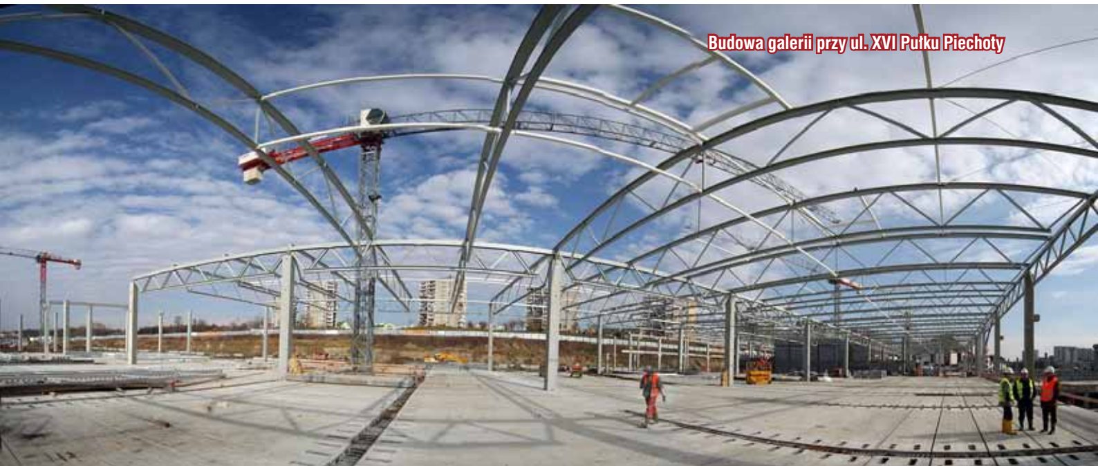
Budowa galerii przy ul. XVI Pułku Piechoty

533 880 543 zł (2008 r.: 427 269 736 zł, 2007 r.: 347 804 919 zł) Wzrost o 186 mln zł