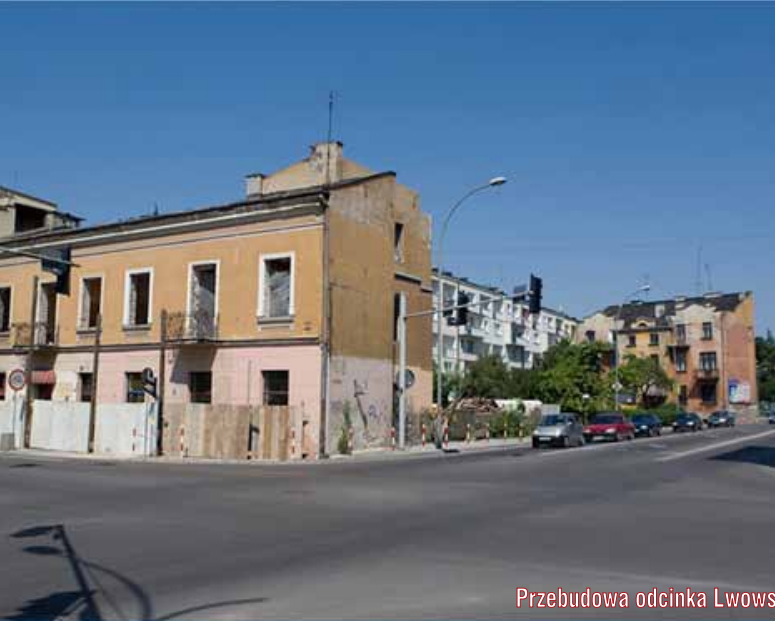
Przebudowa odcinka Lwowska-Starodąbrowska-Mickiewicza

Nowoczesne rozwiązania komunikacyjne oraz poprawa stanu dróg i ulic są priorytetem