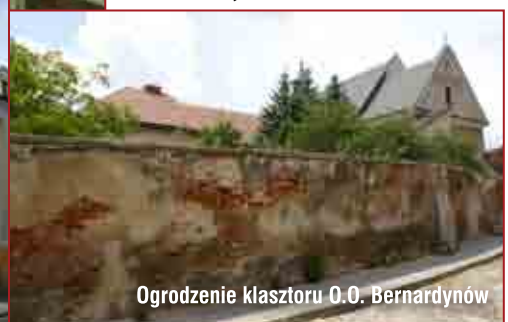
Ogrodzenie klasztoru O.O. Bernardynów

100 tysięcy złotych podzielili tarnowscy radni z przeznaczeniem na prace konserwatorskie w czterech zabytkowych obiektach na terenie miasta. Najwyższa kwota – 45 tysięcy złotych - przeznaczona zostanie na przebudowę muru ogrodzenia klasztoru O.O. Bernardynów.