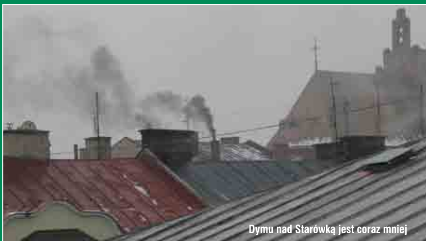
Dymu nad Starówką jest coraz mniej