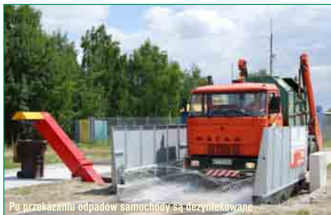
Po przekazaniu odpadów samochody są dezynfekowane

Na finansowanie tego zadania Gmina Miasta Tarnowa uzyskała pożyczkę od Wojewódzkiego Funduszu Ochrony Środowiska i Gospodarki Wodnej w Krakowie w wysokości ponad 4,6 mln zł. Po spełnieniu warunków zapisanych w umowie znaczna część tej kwoty zostanie umorzona.