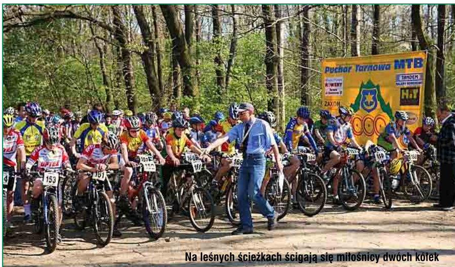
Na leśnych ścieżkach ścigają się miłośnicy dwóch kółek

Z uwagi na malowniczy krajobraz oraz bliskość dużych osiedli mieszkaniowych, Lipie jest ulubionym miejscem rekreacyjnym tarnowian. Stąd roztacza się ładny widok na miasto, położoną na południowym horyzoncie Górę Św. Marcina, a przy dobrej pogodzie na oddalone o 100 km Tatrę. Tędy poprowadzono czerwony szlak rowerowy do Woli Rzędzińskiej oraz turystyczny szlak pieszy, okrążający Tarnów. W Lipiu, zwanym przez kolarzy górskich „parkiem rowerowym”, odbywa się corocznie pierwszy wyścig z cyklu Puchar Tarnowa MTB. Natomiast dla amatorów narciarstwa biegowego organizowany jest tutaj zimą „Bieg Tarnowian”.