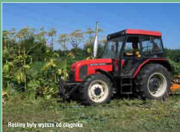
Rośliny były wyższe od ciągnika

ko wymknęła się spod kontroli i roślina rozprzestrzeniła się samorzutnie m.in. na Podhalu i w Pieninach. Pozostaje na jednym stanowisku przez wiele lat. Osiąga 3-4 m wysokości.