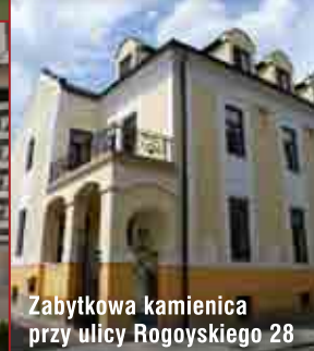
Zabytkowa kamienica przy ulicy Rogoyskiego 28