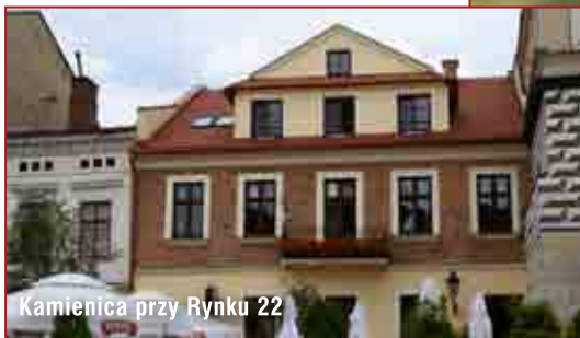
Kamienica przy Rynku 22

Dotację w wysokości 25 tysięcy złotych otrzyma właściciel zabytkowej kamienicy przy ulicy Rogoyskiego 28 w Tarnowie. W tym miejscu zaplanowano prace konserwatorskie, restauratorskie i roboty związane z remontem tego obiektu. Dofinansowanie w identycznej kwocie będzie również przeznaczone na konserwację Kaplicy Rodu Książąt Sanguszków na Starym Cmentarzu w Tarnowie.