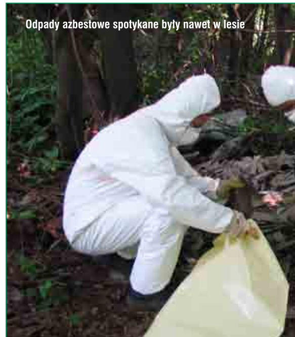
Odpady azbestowe spotykane były nawet w lesie

W tym roku Urząd Miasta kontynuuje akcję pomocy mieszkańcom Tarno-