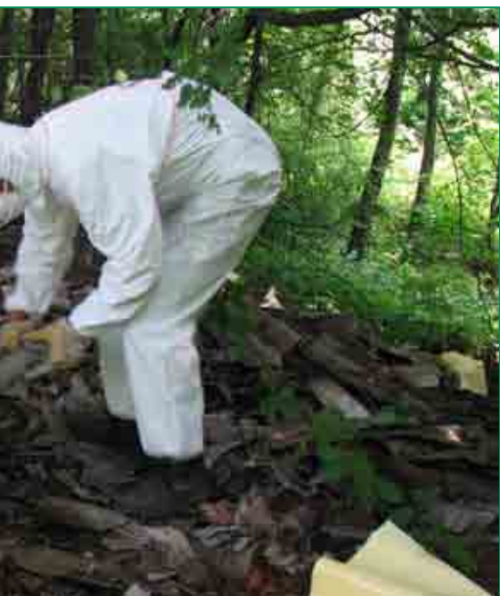
wa w bezpiecznym pozbyciu się odpadów zawierających azbest. Pomoc Miasta

obejmuje usunięcie z posesji odpadów azbestowych, przewiezienie ich na składowisko i unieszkodliwienie. Do dziś usunięto z terenu Tarnowa 571,38 ton odpadów azbestowych. Są one deponowane na składowisku odpadów azbestowych w zabezpieczeniu foliowym pod warstwą nadkładu gruntu. W referacie Ochrony Środowiska UMT prowadzona jest ewidencja obiektów zawierających elementy azbestowe, a właściciele posesji zgłoszonych do rejestru otrzymują systematycznie informacje o aktualnej pomocy w usuwaniu azbestu. Miasto współpracuje też z Urzędem Marszałkowskim, korzystając z wojewódzkiej bazy danych o wyrobach i odpadach zawierających azbest, wprowadzając do ewidencji informacje o rodzaju, ilości i miejscach występowania substancji stwarzających szczególne zagrożenie dla środowiska.