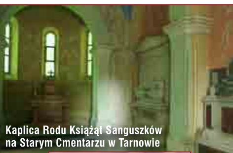
Kaplica Rodu Książąt Sanguszków na Starym Cmentarzu w Tarnowie

R ada Miejska zdecydowała o udzieleniu dotacji celowych na prace konserwatorskie dla kilku zabytkowych obiektów w Tarnowie. Mowa m.in. o przebudowie muru ogrodzenia klasztoru O.O. Bernardynów. Na ten cel z budżetu miasta zostanie przeznaczonych 45 tysięcy złotych. Chodzi o zabezpieczenie, zachowanie oraz utrwalenie substancji zabytku.