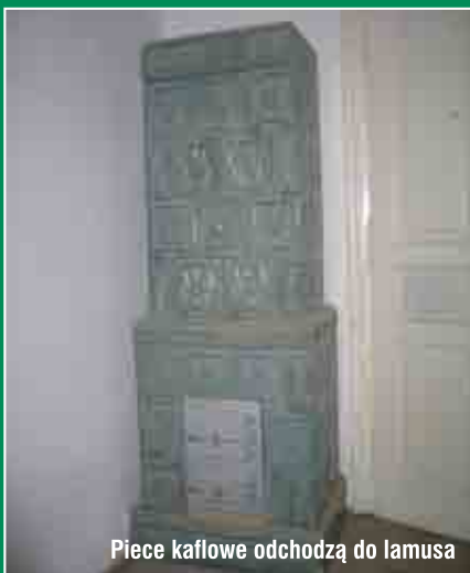
Piece kaflowe odchodzą do lamusa

Wnioski o dofinansowanie przyjmowane są na bieżąco w Biurze Obsługi Mieszkańców Urzędu Miasta Tarnowa, przy ulicy Nowej 4 lub w Referacie Ochrony Środowiska Wydziału Gospodarki Komunalnej i Ochrony Środowiska Urzędu Miasta Tarnowa, przy Goldhammera 3. Dodatkowo informacje można uzyskać pod nr tel. 014 68 82 865.