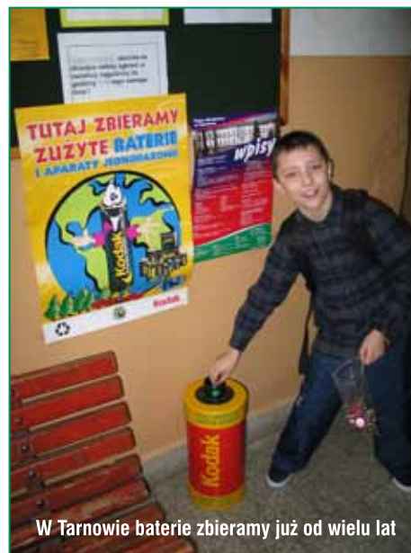
W Tarnowie baterie zbieramy już od wielu lat

W czerwcu bieżącego roku podsumowano poprzednie akcje. Do zbiórki opakowań plastikowych przystąpiło 29 placówek oświatowych z terenu Tarnowa. Łącz-