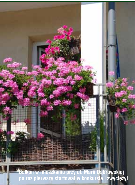
Balkon w mieszkaniu przy ul. Marii Dąbrowskiej po raz pierwszy startował w konkursie i zwyciężył