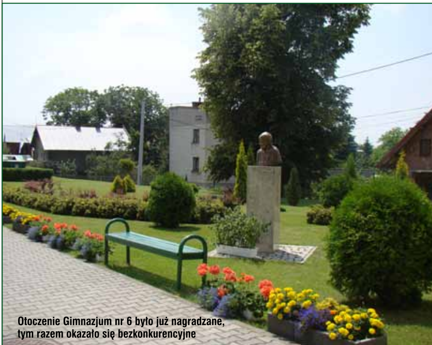
Otoczenie Gimnazjum nr 6 było już nagradzane, tym razem okazało się bezkonkurencyjne

obiektów, najwięcej – 15, balkonów, a także ogrody przy domach jednorodzinnych, ogródki przy budynkach wielorodzinnych oraz ogrody przy jednostkach organizacyjnych.