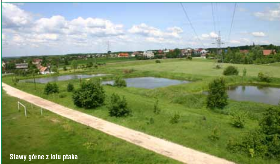
Stawy górne z lotu ptaka

Planowana w latach dziewięćdziesiątych XX wieku budowa autostrady, mimo protestów ekologów, była prowadzona