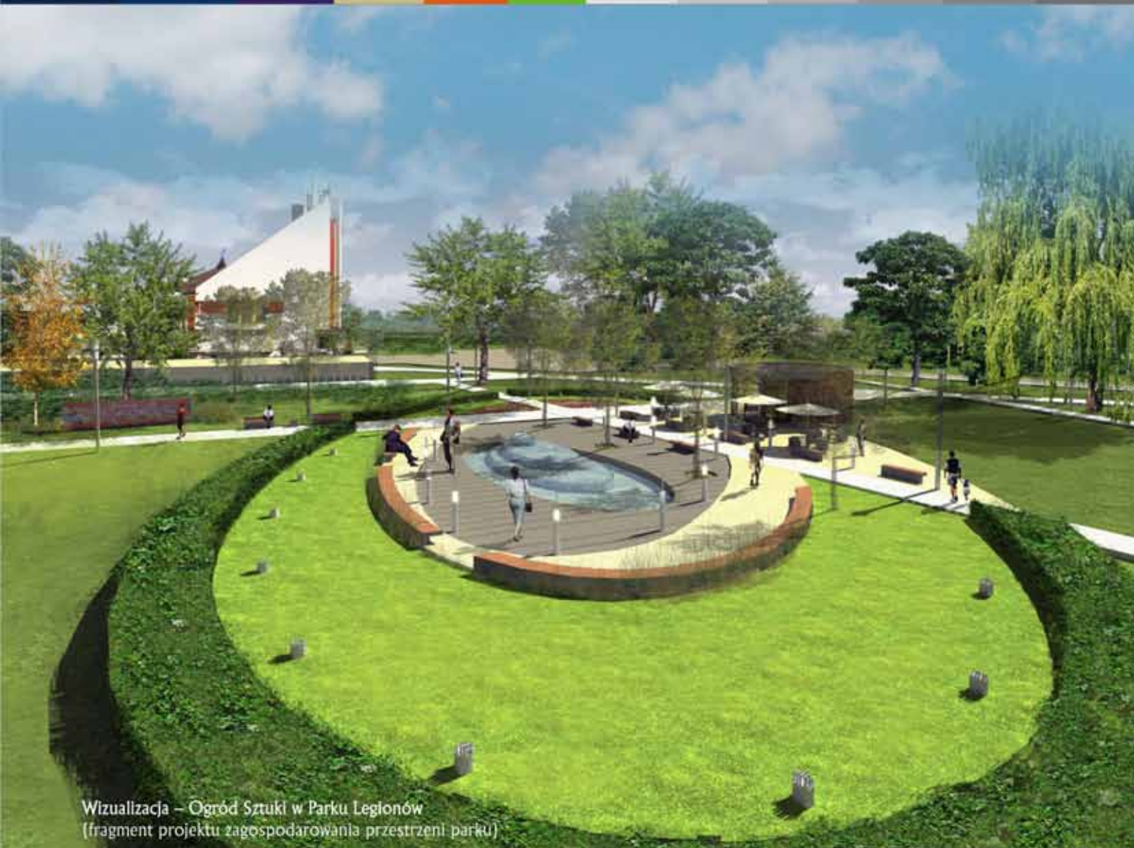
Wizualizacja – Ogród Sztuki w Parku Legionów (fragment projektu zagospodarowania przestrzeni parku)

Tydzień Gospodarczy w Tarnowie i Małopolsce str. 3,17