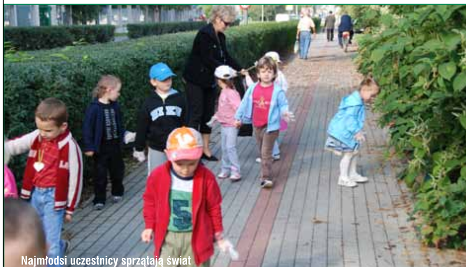
Najmłodszy uczestnicy sprzątnęli świat

Uczestnicy akcji zebrali wiele odpadów opakowaniowych: opakowania szklane i plastikowe, worki foliowe, papier, ale także plastikowe elementy wyposażenia mieszkań i samochodów, wykładzinę podłogową czy panele. Co ważne, nie spotyka się takich niebezpiecznych odpadów jak akumulatory, resztki olejów, świetlówek. Mało jest opon czy baterii. Firma odbierająca odpady po dwóch dniach pracy przewiozła 2,5 tony śmieci, czyli mniej niż w roku ubiegłym. To oznacza, że Tarnów jest coraz bardziej czystym miastem.