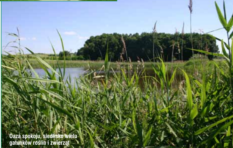
Oaza spokoju, siedlisko wielu gatunków roślin i zwierząt

Zespół dwudziestu „Stawów Krzyskich” składa się z dwóch kompleksów - położonych w górnej części zlewni stawków retencyjnych oraz leżących poniżej dużych stawów towarowych. Górny kompleks obejmuje 13 stawów o łącznej powierzchni 6,66 ha i średniej głębokości 1,3 m. Głównym zadaniem tych stawków jest akumulowanie wody dla stawów hodowlanych i uruchamianie jej w okresach suszy. Dolny obiekt to