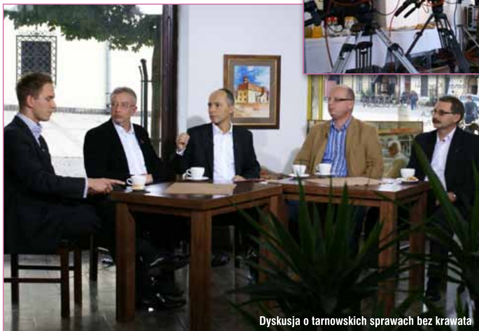
Dyskusja o tarnowskich sprawach bez krawata

Kolejna medialno - promocyjna odsłona miała miejsce 7 października, kiedy po wielu miesiącach starań udało się namówić TVP Kraków i autora progra-