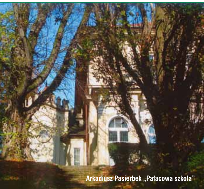
Arkadiusz Pasierbek „Pałacowa szkoła”

Duża liczba prac oraz wysoki poziom fotografii sprawiły, że komisja oceniająca miała niemały problem z wyłonieniem tych najlepszych. Skutkowało to dużą liczbą wyróżnień, nagród dodatkowych, gdyż uznano, że wszystkie wartościowe zdjęcia powinny być