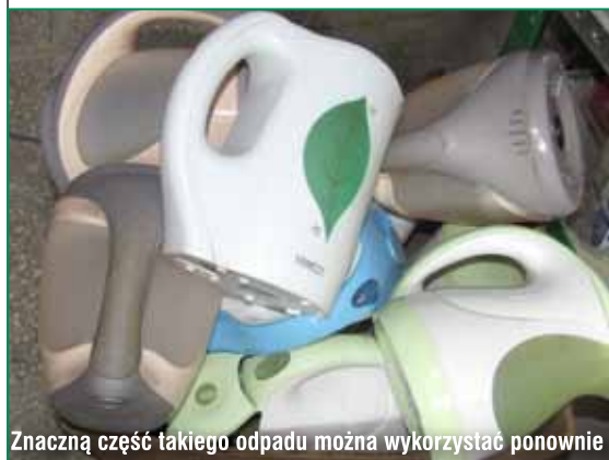
Znaczną część takiego odpadu można wykorzystać ponownie

Elektrośmieci można oddawać także w sklepie, w którym kupujemy nowy sprzęt (w stosunku 1:1), np. kupując nowy telewizor możemy oddać sprzedawcy stary. Wystarczy pamiętać, aby wybierając się na zakupy sprzętu elektrycznego czy elektronicznego zabrać do sklepu niepotrzebny już egzemplarz.