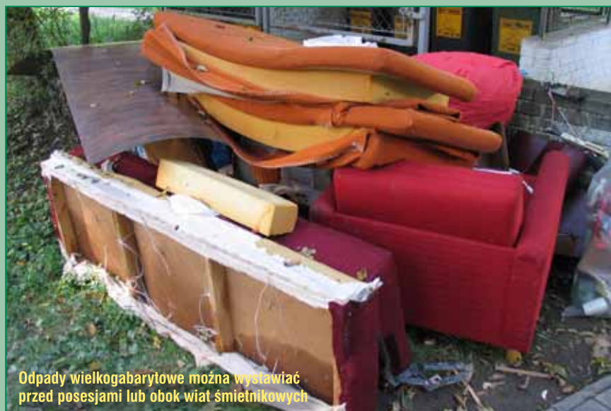
Odpady wielkogabarytowe można wystawiać przed posesjami lub obok wiat śmietnikowych

Odpady wielkogabarytowe należy wystawiać najpóźniej do godziny 9.00 każdego dnia określonego w terminarzu.