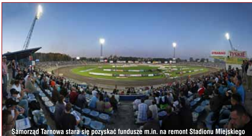
Samorząd Tarnowa stara się pozyskać fundusze m.in. na remont Stadionu Miejskiego

lenie dodatkowych pracowni: technicznej, rękodzieła, zajęć technicznych oraz montaż dźwigu platformowego. Ostatnim nowym projektem jest budowa rotundy dla „Panoramy Siedmiogrodzkiej”. Celem projektu jest budowa miejsca ekspozycji obecnych oraz nabywanych przez miasto kolejnych fragmentów Panoramy Siedmiogrodzkiej na tle repliki wykonanej w skali 1:1, z wykorzystaniem nowoczesnych technik wizualizacji – hologramów i laserów. Realizacja tego pomysłu powinna przyczynić się do zwiększenia atrakcyjności miasta i liczby odwiedzających je turystów.