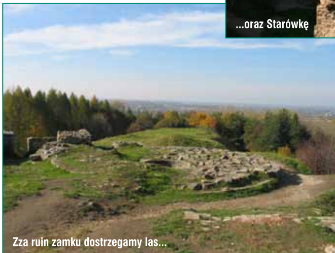
Zza ruin zamku dostrzegamy las...

Z uwagi na wiek drzewostanu, nie był on użytkowany rębnie w okresie powojennym. Prowadzi się jedynie cięcia pielęgnacyjne i sanitarne. Wiek najstarszych drzew wynosi 100-120 lat, a wiek rębności dla występujących tu gatunków określono na