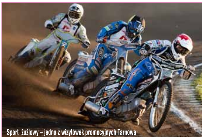
Sport żużlowy – jedna z wizytówek promocyjnych Tarnowa

Tarnowianie uważają ponadto, że Tarnów powinien być miastem turystycznym, kultury, akademickim, przemysłowym, a także handlu i usług.