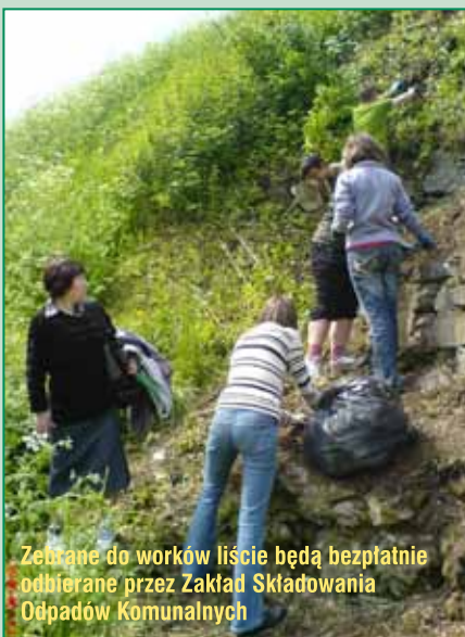
Zbrane do worków liście będą bezpłatnie odbierane przez Zakład Składowania Odpadów Komunalnych

Należy również zwrócić uwagę, aby oprócz liści do worków nie trafiały śmie-