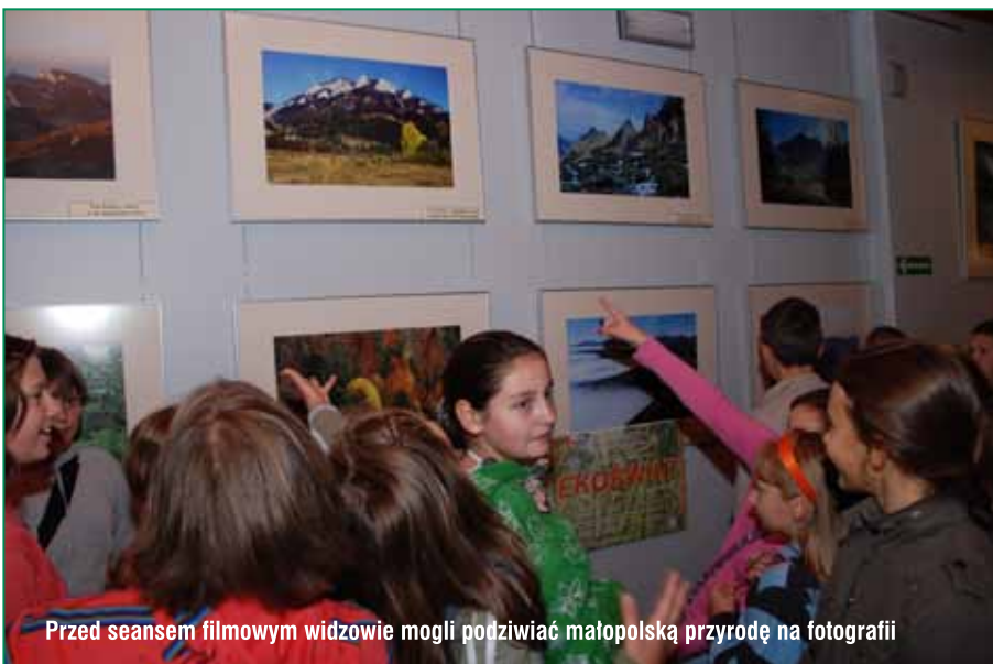
Przed seansem filmowym widzowie mogli podziwiać małopolską przyrodę na fotografii

Organizatorzy – Urząd Miasta Tarnowa oraz Tarnowskie Centrum Kultury - chcieli zwrócić uwagę młodych ludzi na fakt, że wartości, jakimi obdarowała nas natura nie są nam dane „raz na zawsze”. Tę z pozoru oczywistą prawdę doskonale obrazują filmy prezentowane podczas tegorocznej edycji festiwalu. Repertuar został tak skonstruowany, aby mógł być atrakcyjny w odbiorze dla młodych widzów, przy jed-