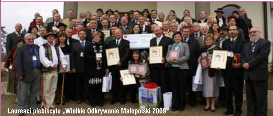
Laureaci plebiscytu „Wielkie Odkrywanie Małopolski 2009”

Zgodnie z tradycją przyszłoroczna impreza – Małopolskie Obchody Światowego Dnia Turystyki i finał kolejnej edycji plebiscytu Wielkie Odkrywanie Małopolski odbędzie się w Tarnowie.