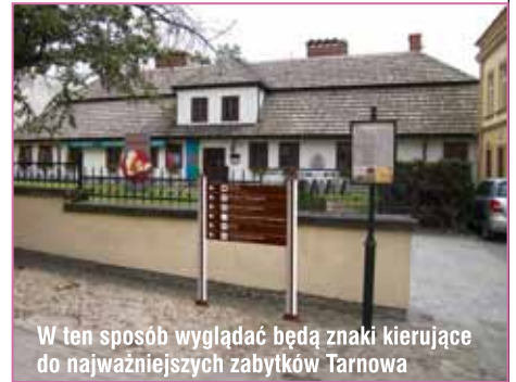
W ten sposób wyglądają będą znaki kierujące do najważniejszych zabytków Tarnowa

Małopolski. W tym roku rozstrzygnięto jubileuszową, dziesiątą edycję plebiscytu. W najbardziej prestiżowej kategorii „Miejscowość” zwyciężył Tarnów. To już drugi taki sukces, po raz pierwszy miasto wygrało w plebiscycie w 2005 roku. Oznacza to, że do Tarnowa trafi m. in. nagroda w wysokości 50 tysięcy złotych. Kwota ta zostanie przeznaczona na oznakowanie turystyczne Tarnowa. W kategorii „Baza noclegowa” zwyciężył Camping nr 202 „Pod Jabłoniemi” z Tarnowa, a w kategorii „Baza gastronomiczna” tar-