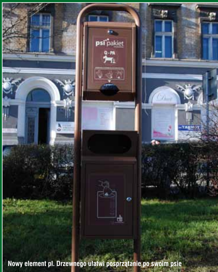
Nowy element pl. Drzewnego ułatwi posprzątanie po swoim psie

Środowiska i Gospodarki Wodnej w Krakowie. Wszystkie nagrodzone i wyróżnione fotografie oraz zdjęcia z finału konkursu można obejrzeć na stronie internetowej www.tarnow.pl w zakładce galeria-ekologia.