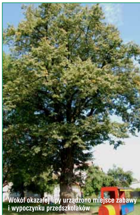
Wokół okazałej lipy urządzono miejsce zabawy i wypoczynku przedszkolaków

jobrazowymi. Objęcie tego drzewa ochroną i umieszczenie odpowiedniej tabliczki na pniu uświadomi mieszkańcom dużą