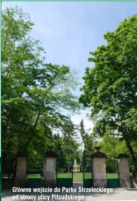
Główne wejście do Parku Strzeleckiego od strony ulicy Piłsudskiego

Broszurki są przeznaczone dla wszystkich zainteresowanych problematyką ochrony środowiska, chcących poznać ciekawe zakątki przyrodnicze w Tarnowie. Zawarte w publikacjach informacje oraz liczne fotografie przybliżą te atrakcyjne miejsca wypoczynku i re-