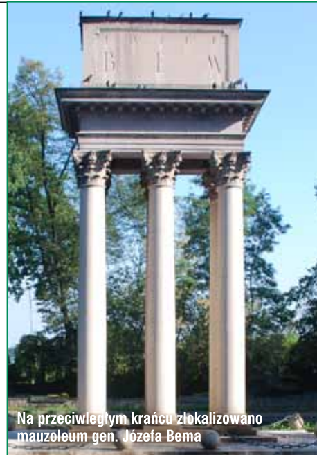
Na przeciwnym krańcu zlokalizowano mauzoleum gen. Józefa Bema

O atrakcyjności Parku Strzeleckiego stanowi również jego architektura. Najokazalszym obiektem jest neogotycki pałacyk Towarzystwa Strzeleckiego z 1866 roku, który po II wojnie światowej był siedzibą Komendy Hufca ZHP, a od 2004 roku znajduje się w posiadaniu Bractwa Kurkowego. Stojący obok pałacu budynek w stylu secesji wiedeńskiej to dom ogrodnika miejskiego, którego budowę ukończono w 1907 roku. W związku z budową w Tarnowie wodociągu pojawił się projekt wykonania w parku wodotrysku, który zrealizo-