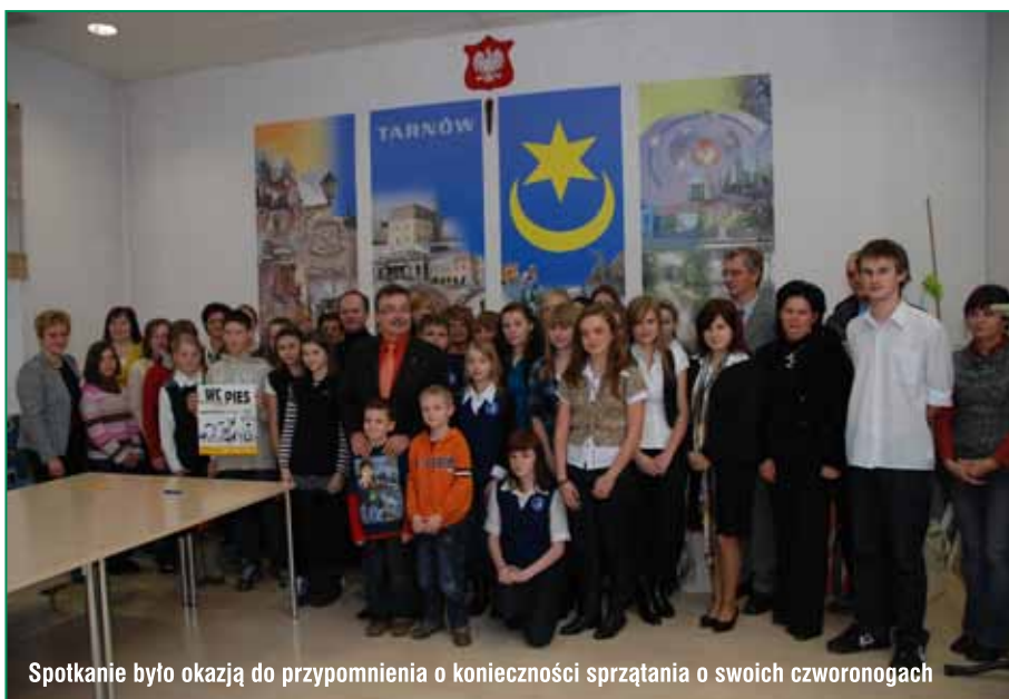
Spotkanie było okazją do przypomnienia o konieczności sprzątania o swoich czworonogach

Tegoroczna edycja akcji „Sprzątanie Świata” odbyła się w dniach 18 – 20 września pod hasłem „Pomagajmy Ziemi - codziennie”. W tarnowskiej akcji wzięło udział ponad 6200 uczestników. Zebrano blisko