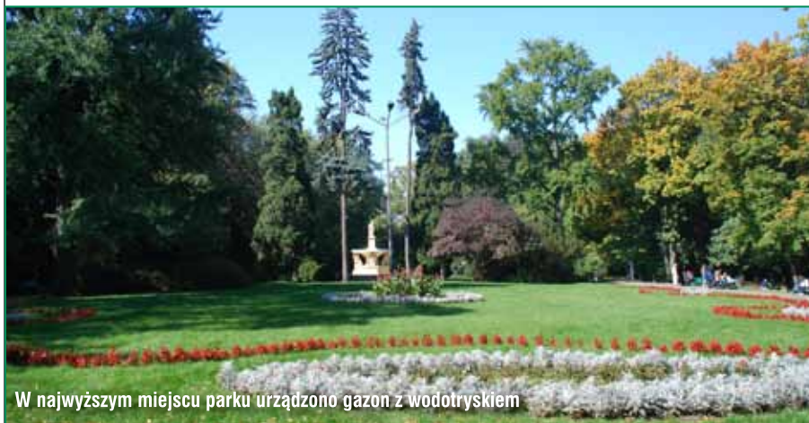
W najwyższym miejscu parku urządzone gazon z wodotryskiem

Park Strzelecki był pierwszym w Tarnowie tak dużym, publicznym terenem rekreacyjnym, stąd ogromne powodzenie, jakim cieszył się od początku swego istnienia. Urządzano w nim większość festynów i koncertów, których centralnym punktem była nieistniejąca już drewniana altana obok wodotrysku. Po II wojnie światowej przeniesiono organizację zabaw w inne miejsca miasta, przez co charakter parku zmienił się na spokojniejszy, spacerowo-kontemplacyjny, aczkolwiek niektóre masowe imprezy nadal urządza się tutaj, jak np. „Bieg Sokółów” z okazji Święta Niepodległości 11 Listopada. Zgoła inny charakter ma gwarny zazwyczaj ogródek jordanowski, wyposażony w coraz bezpieczniejsze i nowocześniejsze urządzenia zabawowe. Nieco powyżej ogródka rosną dęby, klony oraz lipa posadzone w ostatnich latach dla upamiętnienia odbywających się w mieście wydarzeń związanych z ochroną przyrody. W tej scenerii wręczane są corocznie statuetki „Tarnowskiego Ekologa” – nagrody Prezydenta Miasta Tarnowa honorujące osoby najbardziej zaangażowane w działania na rzecz ochrony przyrody.