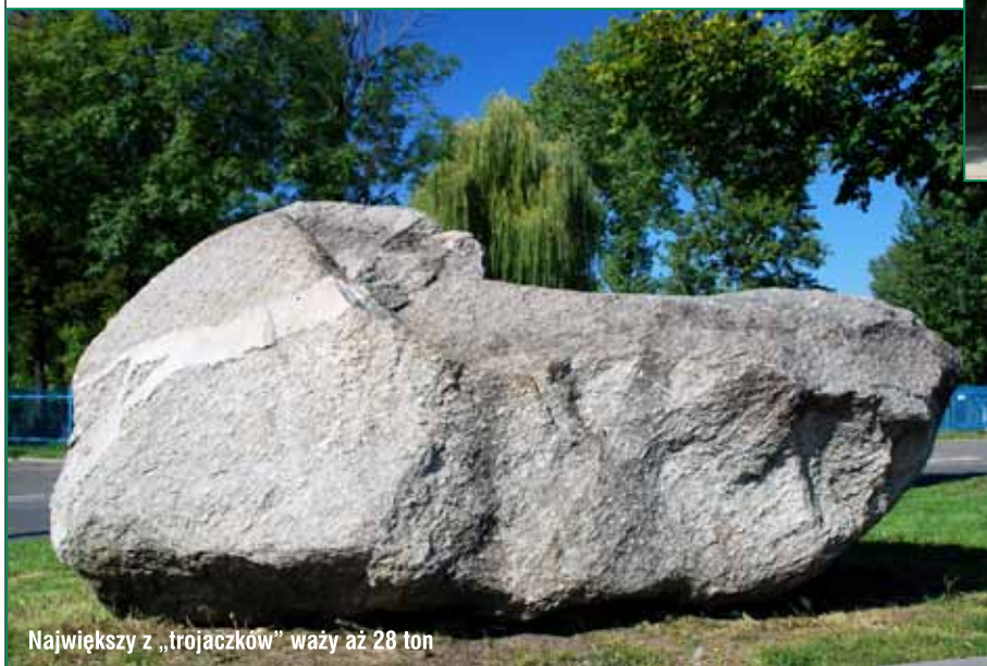
Największy z „trojaczków” waży aż 28 ton

kładem Urzędu Miasta. Opisują one Park Strzelecki oraz głazy narzutowe - „tro-