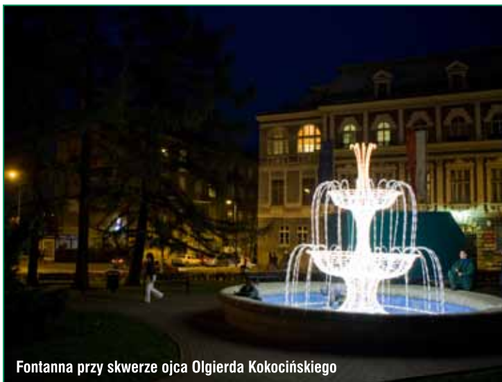
Fontanna przy skwerze ojca Olgierda Kokocińskiego

Wykonawca ozdób - firma ze Śląska - zapewnia wieloletnią działalność i estetykę urządzeń, gwarantującą upiększenie miejskich przestrzeni, przynajmniej na czas jesienno - zimowy. Całkowity koszt trzech instalacji wyniósł niespełna 66 tysięcy złotych.