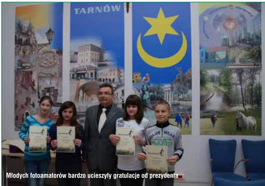
Młodych fotoamatorów bardzo ucieszyły gratulacje od prezydenta

Uczestnicy oraz goście przybyli na podsumowanie konkursu mogli obejrzeć fotografie, podziwiać piękno tarnowskiej przyrody i architektury oraz podyskutować na temat fotografowania przyrody i krajobrazu. Była to też dobra okazja do wymiany doświadczeń, spostrzeżeń i doskonalenia umiejętności podglądania przyrody i przybliżania jej piękna, nie zawsze widocznego dla żyjących w pośpiechu mieszkańców.