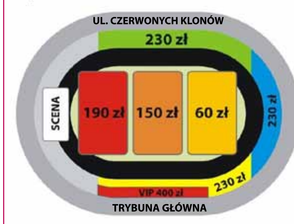
Ceny biletów oraz rozkład sektorów

znaczone zostały dodatkowe miejsca parkingowe i drogi dojazdu na Stadion Miejski w Mościcach. Z uwagi na częściowe zamknięcie ulic wokół Stadionu Miejskiego i mogące w związku z tym wyniknąć problemy z dostaniem się na koncert prywatnymi samochodami, uruchomiona zostanie