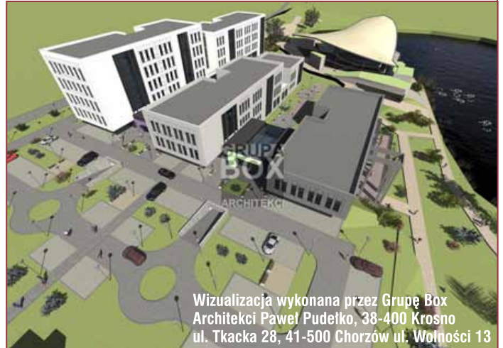
Wizualizacja wykonana przez Grupę Box Architekci Paweł Pudełko, 38-400 Krosno ul. Tkacka 28, 41-500 Chorzów ul. Wolności 13

nowoczesnych technologii do działających tu już przedsiębiorstw i zapewnienie wzrostu ich efektywności, tworzyć zaplecze kadr dla gospodarki i samorządu. Umowa zakłada współpracę członków konsorcjum w tworzeniu warunków dla realizacji inwestycji w służbie zdrowia,