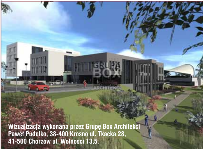
Wizualizacja wykonana przez Grupę Box Architekci Paweł Pudełko, 38-400 Krosno ul. Tkacka 28, 41-500 Chorzów ul. Wolności 13,5.

Sygnatariuszami umowy podpisanej w tarnowskim magistracie w obecności skarbnika miasta są Azoty Tarnów S.A., Państwowa Wyższa Szkoła Zawodowa, Tarnowski Klaster Przemysłowy, Stowarzyszenie Miasta w Internecie, Klaster Medycyna Polska oraz spółka partnerska „Adwokaci”.