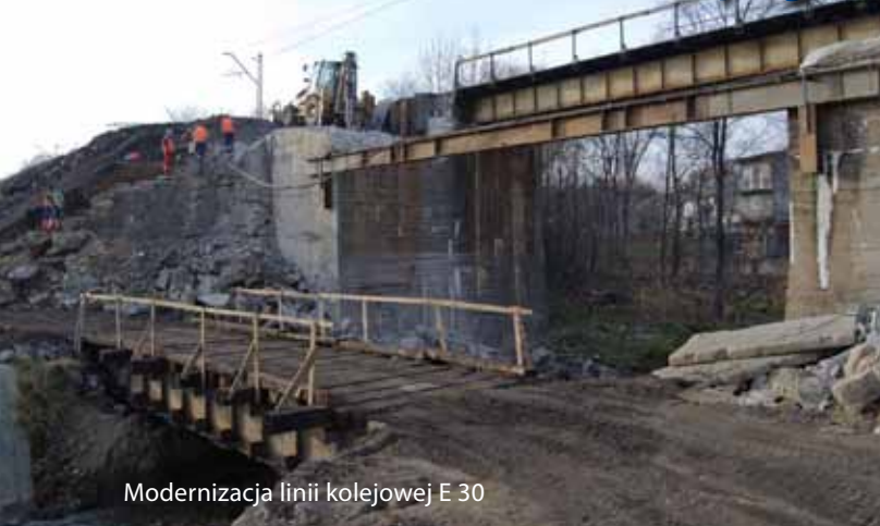
Modernizacja linii kolejowej E 30