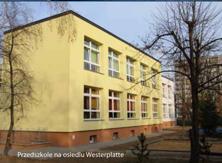
Przedszkole na osiedlu Westerplatte