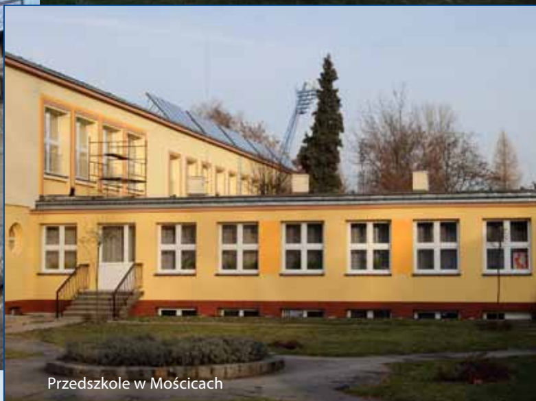
Przedszkole w Mościcach