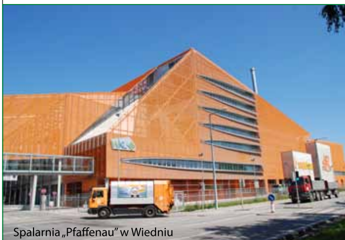
Spalarnia „Pfaffenau” w Wiedniu

Z dotychczas przeprowadzonych analiz wynika, że z dostępnych aktualnie sposobów zagospodarowania odpadów najkorzystniejsze dla środowiska i zdrowia ludzi jest prowadzenie wstępnej segregacji odpadów już u źródła, a więc na poziomie nas wszystkich – wytwórców odpadów, a następnie skierowanie odzyskanych surowców wtórnych do recyklingu. Pozostały balast należy wykorzystać do produkcji energii cieplnej i elektrycznej w nowoczesnych instalacjach termicznego przekształcania odpadów.