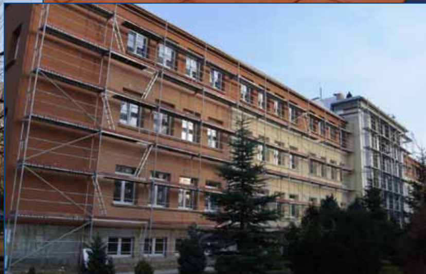
Zespół Szkół Ogólnokształcących nr 1