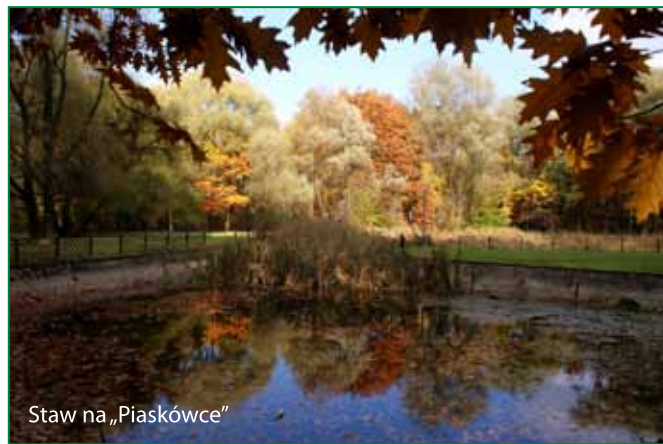
Staw na „Piaskówce”

dowiedzieć, że dla Tarnowa najbardziej korzystnym rozwiązaniem jest dopięcie systemu gospodarki odpadowej realizacją zakładu termicznego przekształcania odpadów, zaś co do lokalizacji, to z trzech proponowanych miejsc najkorzystniejsze jest zbudowanie instalacji przy ul. Cmentarnej, w rejonie istniejącego Zakładu Składowania Odpadów Komunalnych.