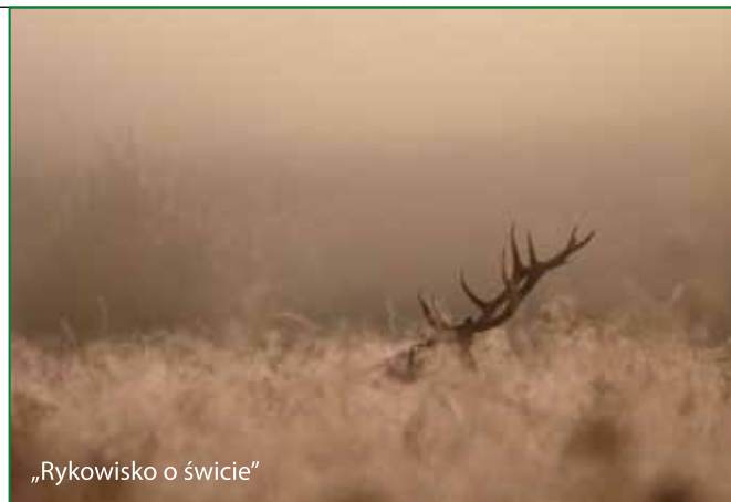
„Rykowisko o świcie”