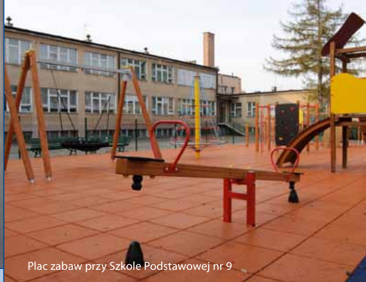
Plac zabaw przy Szkole Podstawowej nr 9