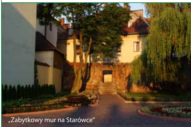
„Zabytkowy mur na Starówce”

Nagrody zostały ufundowane przez Urząd Miasta Tarnowa. Wszystkie nagrodzone i wyróżnione fotografie można obejrzeć na stronie internetowej www.tarnow.pl