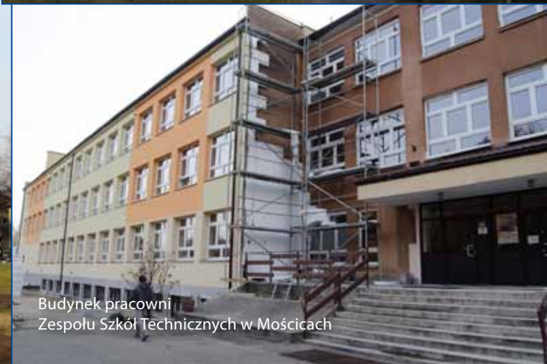
Budynek pracowni Zespołu Szkół Technicznych w Mościcach