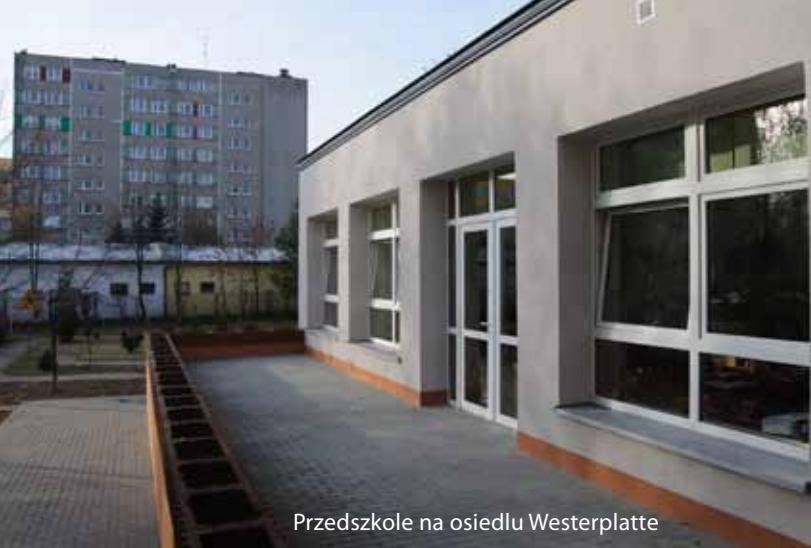
Przedszkole na osiedlu Westerplatte