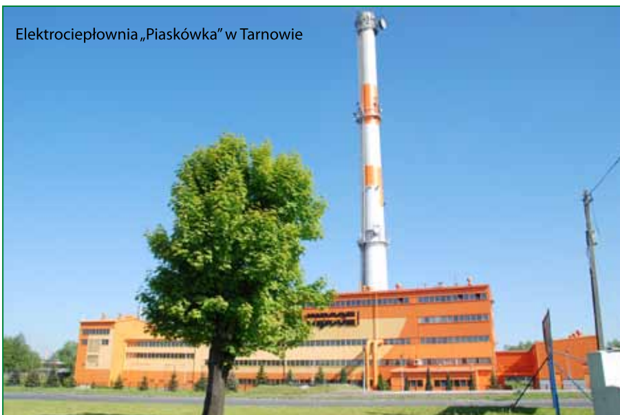
Elektrociepłownia „Piaskówka” w Tarnowie