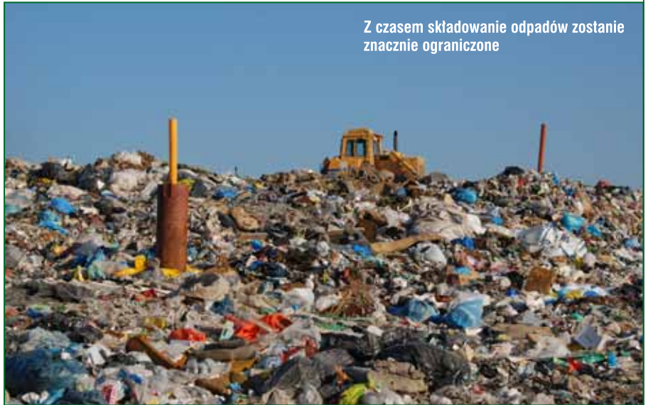
Z czasem składowanie odpadów zostanie znacznie ograniczone

Póki co mieszkańcy nie odczuwają żadnych zmian związanych z funkcjonowaniem systemu gospodarki odpadami, ale nie oznacza to, że w tej sprawie nic się nie dzieje. Ustawa daje czas do 1 lipca 2013 r. na wprowadzenie nowych zasad. W tym okresie ogrom pracy muszą wykonać osoby wdrażające przepisy w życie, przygotowujące i przyjmujące niezbędne uchwały, organizujące przetargi, a także wdrażające działania edukacyjne popularyzujące wiedzę o środowisku i podnoszące świadomość społeczeństwa. Za półtora