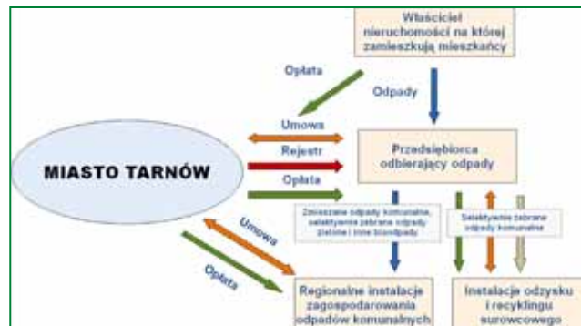
Schemat docelowego systemu gospodarki odpadami komunalnymi pochodzącymi od mieszkańców Tarnowa (oprac. Savona Project)

duża powierzchnia do ustawienia pojemników, wyższy koszt transportu dla każdej frakcji oraz konieczność odbioru od każdego wytwarzającego, trudny do skutecznego zastosowania w zabudowie wielorodzinnej wysokiej, - pojemniki w „gniazdach”. System podobny do opisanego powyżej, stosowany tam, gdzie jest odpowiednie miejsce do utworzenia „gniazda” – ustawienia kilku kolorowych pojemników „igloo”, („dzwonów”). Zaletą systemu jest ułatwienie odzysku i recyklingu, oddziaływanie na świadomość ekologiczną także osób niezaangażowanych bezpośrednio w segregację odpadów. Trudnością jest znalezienie odpowiednio dużego placu z dojazdem