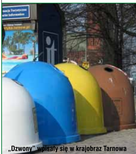
„Dzwony” wpisały się w krajobraz Tarnowa

i konieczność znalezienia dodatkowych środków na zakup pojemników, - zbiórka dwupojemnikowa (podział na frakcje suchą i mokrą): podobny do obecnie funkcjonującego w Tarnowie. Osobno zbierane są „suche” surowce wtórne (papier i tektura, szkło, tworzywo sztuczne, metale) oraz „mokre” pozostałe odpady. Zaletą tego systemu jest bardzo łatwe gromadzenie odpadów (tylko dwa pojemniki) nawet w niewielkich gospodarstwach domowych, w tym w zabudowie wielorodzinnej oraz prosty transport. Wadą: pomimo prostoty, wymaga jednak zaangażowania korzystających, a odpady wymagają dalszego sortowania na poszczególne rodzaje,