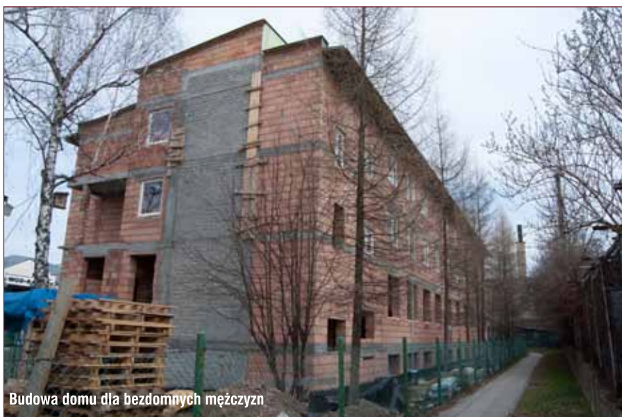
Budowa domu dla bezdomnych mężczyzn