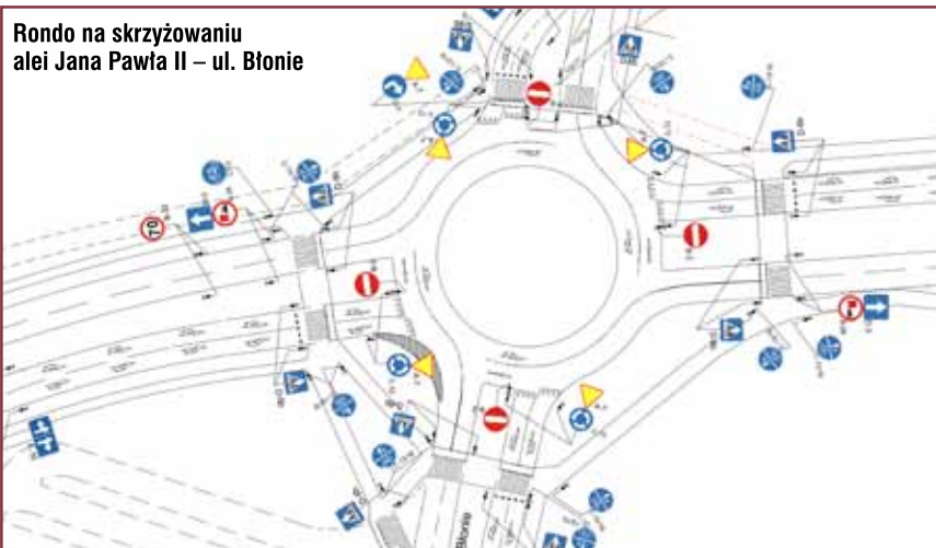
Rondo na skrzyżowaniu alei Jana Pawła II – ul. Błonie

Do tej pory w ramach inwestycji wybudowano połączenie ul. Starodąbrowskiej z ul. Gumniską wraz z rozbudową skrzyżowania Starodąbrowska-Kołątaja oraz przebudową ul. Gumniskiej, Dąbrowskiego i ul. Ziai. Projekt współfinansowany jest z Europejskiego Funduszu Rozwoju Regionalnego w ramach Małopolskiego Programu Operacyjnego. Jego całkowita wartość wynosi 89 mln złotych, w tym dofinansowanie to 53 mln zł. Pozostałe środki pochodzą z budżetu miasta.