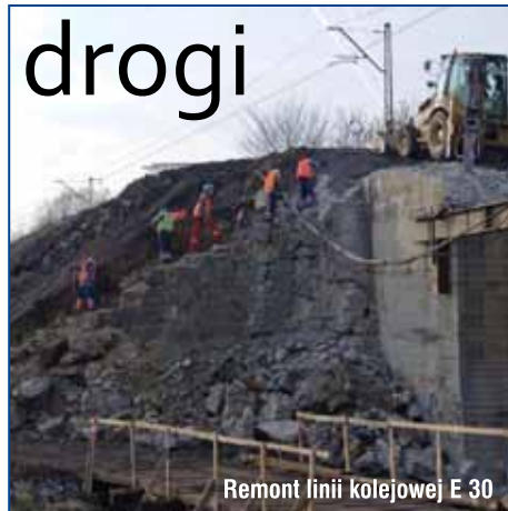
Remont linii kolejowej E 30

Co jeszcze się zmieni? Swój ostateczny kształt uzyska dworzec PKP, gdzie wyremontowane zostaną perony i przejście podziemne, łącznie z przebiegiem w kierunku