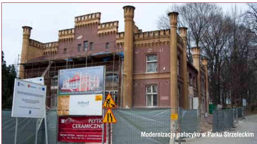
Modernizacja pałacyku w Parku Strzeleckim

Tegoroczny budżet Tarnowa zakłada ponad 113 milionów złotych na zadania na inwestycje majątkowe. Dla porównania, Nowy Sącz planuje w tym roku zainwestować ok. 16 milionów złotych.