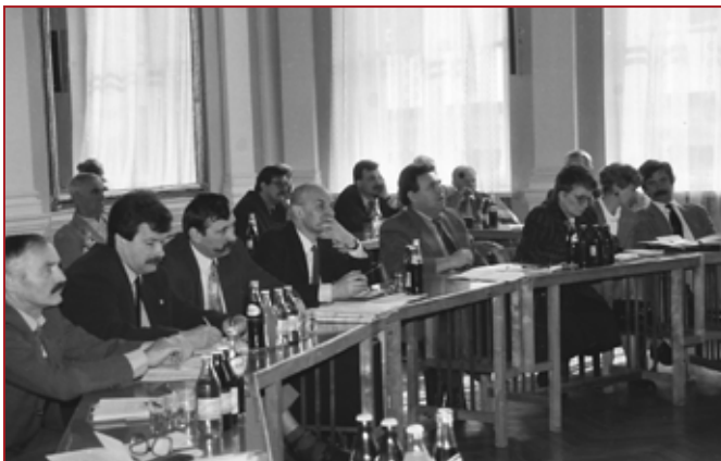
Posiedzenie Rady Miejskiej w Tarnowie I Kadencji. Początek lat 90.