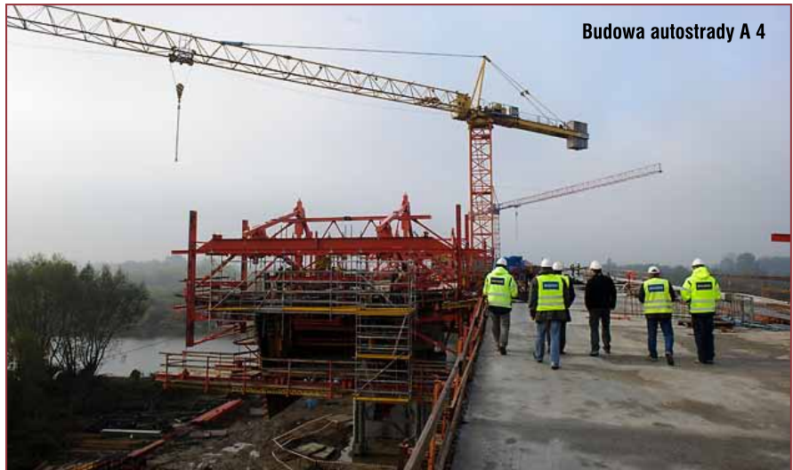
Budowa autostrady A 4

Postanowiono również, że dokumentacja studyjno-konceptyjna musi obejmować planowane połączenie tego ciągu z ul. Krakowską w Tarnowie. To jedna z kluczowych inwestycji drogowych dla naszego miasta. Tereny inwestycyjne muszą