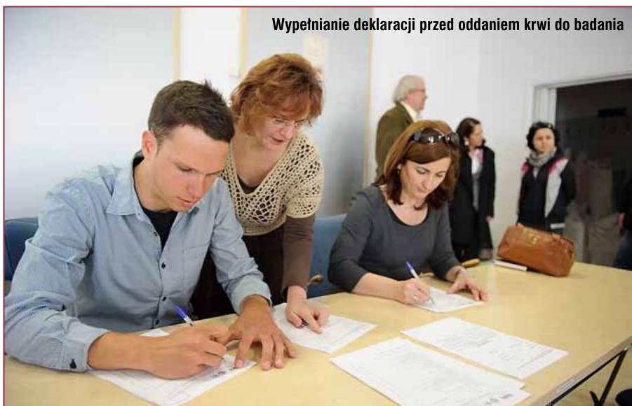
Wypełnianie deklaracji przed oddaniem krwi do badania

Marcowa akcja badania kandydatów na dawców to tylko początek planów Stowarzyszenia „Kropla” w bieżącym roku. Pod koniec maja w Tarnowie odbędzie się Jubileuszowa Gala X Tarnowskiej „Kropki”, w której udział wezmą m.in. zarówno dawcy jak i biorcy, mali pacjenci Kliniki Transplantacji we Wrocławiu oraz uczestnicy Akademii Młodych PWSZ. Gwiazdą wieczoru będzie Mietek Szcześniak . Jesienią natomiast, z inicjatywy „Kropki”, zaplanowano ogólnopolską konferencję dla organizacji pozarządowych.