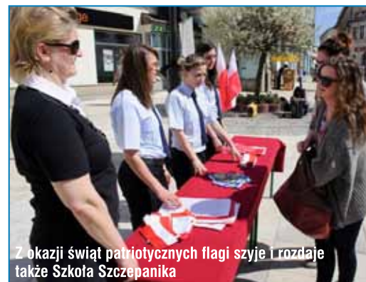
Z okazji świąt patriotycznych flagi szyje i rozdaje także Szkoła Szczepanika

Tarnowska akcja jest jedynym wydarzeniem tego typu w Polsce. Organizowana jest dwa razy do roku – z okazji Święta Niepodległości oraz majowych świąt - Dnia Flagi Państwowej RP i Konstytucji 3 Maja.