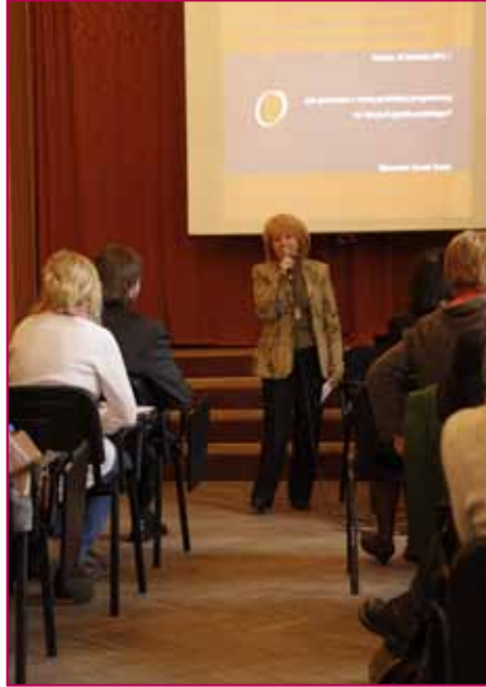
Konferencja „Warsztat nauczyciela polonisty w świetle nowej podstawy programowej” w I LO.

Na czym – w największym skrócie – polega reforma? Trzon lektur pozostaje taki sam, zmienia się natomiast filozofia nauczania. Chodzi bardziej o kształcenie umiejętności uczniów, niż zdobycie encyklopedycznej wiedzy i jej bierne odtwarzanie. Liczyć się będą umiejętności komunikacyjne, skuteczne czytanie ze zrozumieniem, przekształcanie zdobytych informacji, własne interpretacje, budowanie samodzielnych opinii, ich wyrażanie.