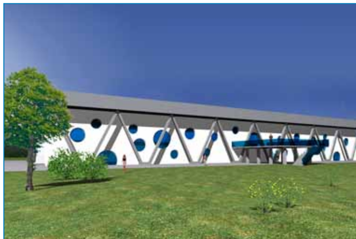
Wizualizacja Miejskiego Domu Sportu wykonana przez firmę MWM Sp. z o.o. z Gliwic, która wygrała przetarg na opracowanie projektów technicznych przebudowy MDS.

Konkretne działania podjęte zostały już w przypadku Miejskiego Domu Sportu. Poza tym, że zrealizowano niezbędne działania remontowe oraz przeprowadzono prace naprawcze, rozstrzygnięto także przetarg na opracowanie projektu MDS i zagospodarowanie jego otoczenia. Wykonawcą została gliwicka firma MWM.