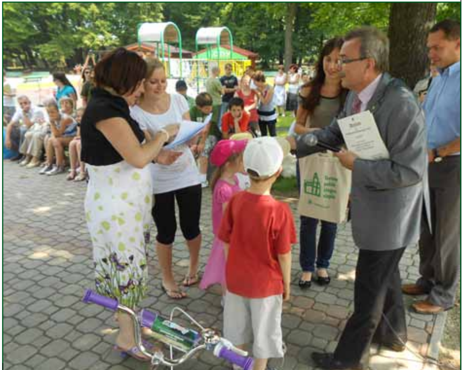
Dzięki magistratowi i sponsorom najaktywniejsi młodzi ekolodzy otrzymali upominki

W siódmej edycji zbiórki opakowań plastikowych, przygotowanej wspólnie z Przedsiębiorstwem Obrótu Surowcami Wtórnymi KOMETAL, zebrano ponad 24 tony opakowań plastikowych czyli blisko 900 tys. popularnych PET-ów. Jako surowiec wtórny posłużą one do produkcji nowych wyrobów.