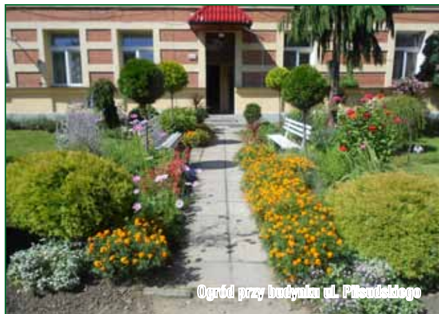
Ogród przy budynku ul. Piłsudskiego