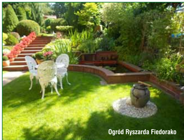
Ogród Ryszarda Fiedorako