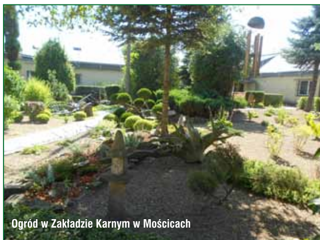
Ogród w Zakładzie Karnym w Mościcach