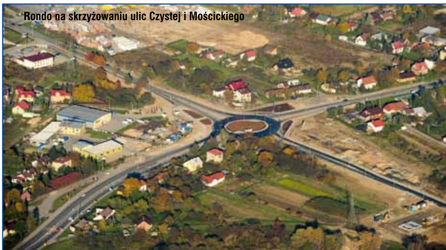
Rondo na skrzyżowaniu ulic Czystej i Mościckiego