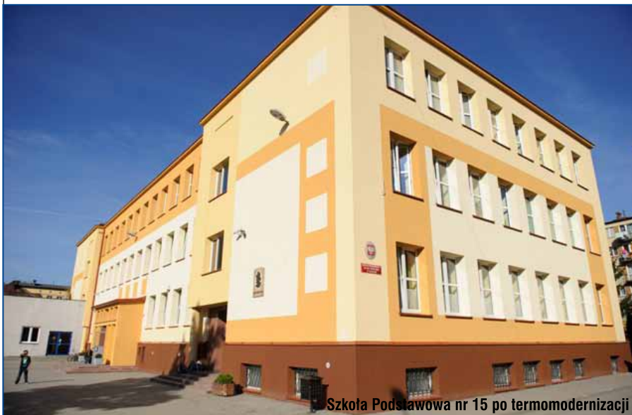
Szkoła Podstawowa nr 15 po termomodernizacji

portu zbiorowego, czystości i zieleni w mieście, odśnieżanie, gospodarka odpadami, w tym utrzymanie składowiska odpadów, ochrona zdrowia, mieszkalnictwo, pomoc społeczna oraz kultura i sport. Mimo tylu potrzeb na nowe inwestycje po raz kolejny wydamy kwotę niemalą, będzie to prawie 80 mln zł. To cały czas odrabianie zaległości i czasu, gdy miasto było niedoinwestowane. Miasto musi stawać się coraz bardziej atrakcyjne, zarówno dla mieszkańców, jak i przedsiębiorców. Oczywiście, aby sprostać wszystkim zadaniom, tym obowiązkowym, jak i tym inwestycyjnym, wprowadzamy niezbędne oszczędności. Zaczęliśmy od tych związanych z energią. Wspólne w skali miasta zakupy energii elektrycznej to oszczędności blisko 700 tys. zł. To samo dotyczy wspólnych zakupów materiałów i ubezpieczenia majątku. To kolejne 350-400 tys. zł. W przyszłym roku znacznie mniej zapłacimy za ciepło - to wynik realizowanej termomodernizacji i kolejne co najmniej kilkaset tysięcy. Ekonomizacja szkół i ścisły monitoring kosztów eksploatacyjnych (media, utrzymanie i wykorzystanie powierzchni) to co najmniej milion zł. Te decyzje ograniczają nieco swobodę działania dyrektorów jednostek organizacyjnych, ale przynoszą pozytywny dla budżetu skutek. Schodzimy też z kosztów administracyjnych i urzędniczych - to wynik dokonanej reorganizacji oraz inwestycji w informatyzację miasta i samorządu.