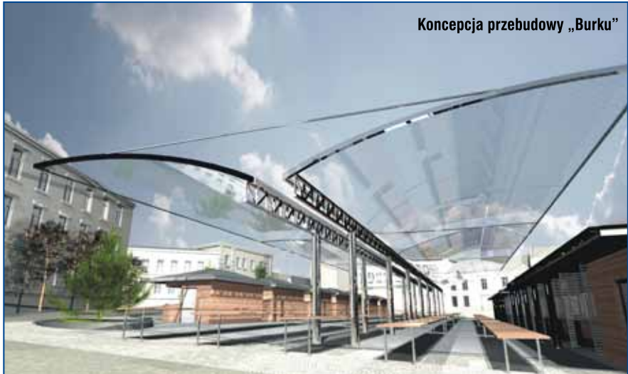
Koncepcja przebudowy „Burku”

Zadania miasta również dzielą się na te, które musimy zrealizować, bo zostały nam powierzone do wykonania przez rząd i na które dostajemy środki, jak i te, które chcemy wykonać spełniając potrzeby mieszkańców. W całym kraju słychać jednak głosy, że samorządom zleca się wiele zadań, nie przekazując wystarczających środków na ich realizację. Tak też jest w przypadku Tarnowa. A największą różnicę notujemy w przypadku zadań oświatowych. W tej dziedzinie z naszych „własnych” dochodów dołożyć musimy blisko 70 mln zł. Przy planowaniu budżetu zadaniem prezydenta jest taki dobór propozycji, który zaspokoi potrzeby jak największej liczby mieszkańców oraz pozwoli na dobre funkcjonowanie infrastruktury miasta obecnie i w przyszłości. Ostateczny kształt budżetu jest wypadkową kilku czynników, m.in. głosów, które padają w procesie konsultacji społecznych i zmian proponowanych przez radnych Rady Miejskiej. Budżet powinien też pozwalać na realizację