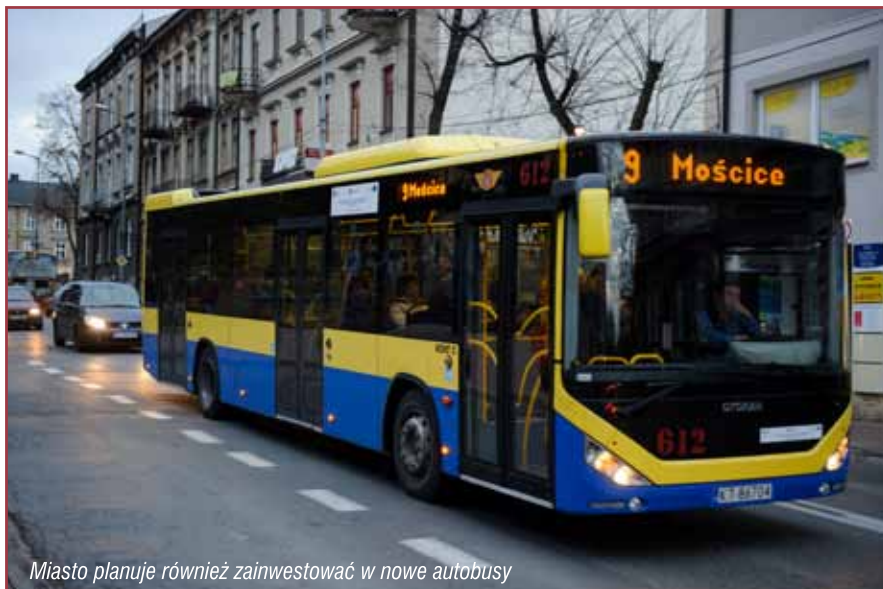
Miasto planuje również zainwestować w nowe autobusy