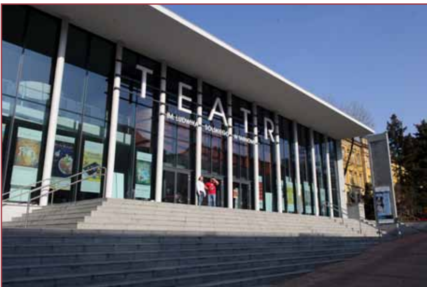
Tarnów ma szansę na kolejne miliony euro z budżetu Unii Europejskiej. Za środki pozyskane w latach 2007-2013 zmodernizowano m.in. tarnowski teatr

Z kolei nowa zajezdnia ma powstać przy ul. Błonie. Co więcej za unijne dofinansowanie ma zostać zakupionych 30 nowoczesnych, niskopodłogowych autobusów o niskiej emisji zanieczyszczeń wyposażonych w biletomaty.