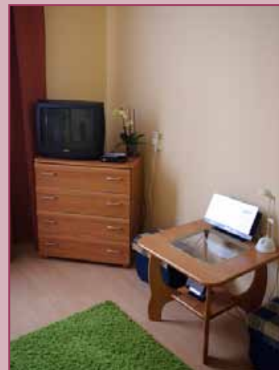
Stowarzyszenie na Rzecz Osób z Upośledzeniem Umysłowym – Koło w Tarnowie.

Warto dodać, że od czerwca 2013 r. przy ul. Psennej funkcjonuje mieszkanie chronione dla usamodzielnianych wychowanków z rodzinnej i instytucjonalnej pieczy zastępczej, przeznaczone dla trzech osób. Podobnie jak mieszkanie przy ul. Mościckiego prowadzone jest przez Polskie