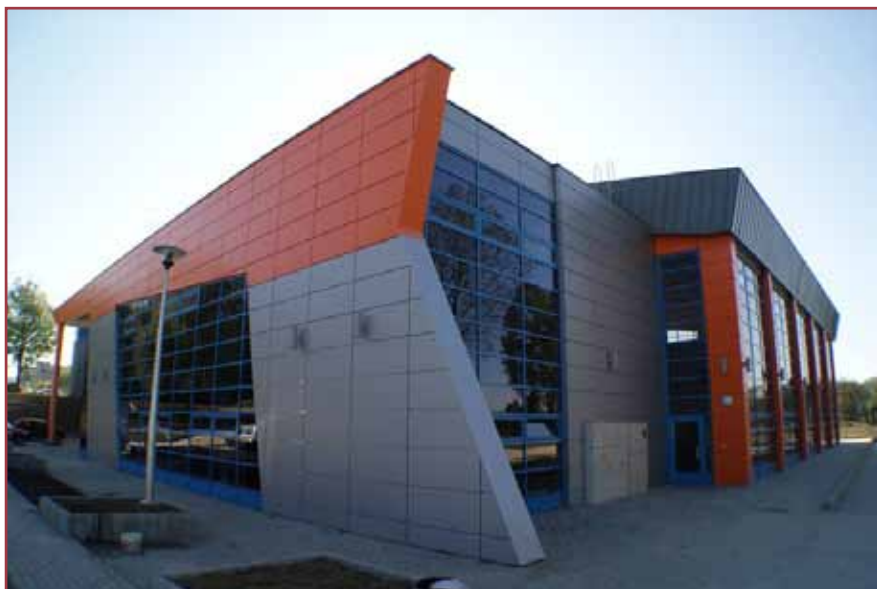
Poprzedni budżet unijny to także pieniądze na rozbudowę basenu przy ul. Piłsudskiego