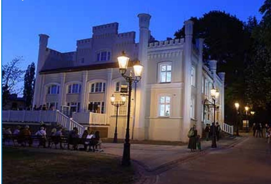
Pałacyk w Parku Strzeleckim

Sprawność i jakość działania Urzędu Miasta Tarnowa podkreśla certyfikat jakości ISO wydany po raz kolejny przez Polskie Centrum Badań i Certyfikacji S.A. w Warszawie.