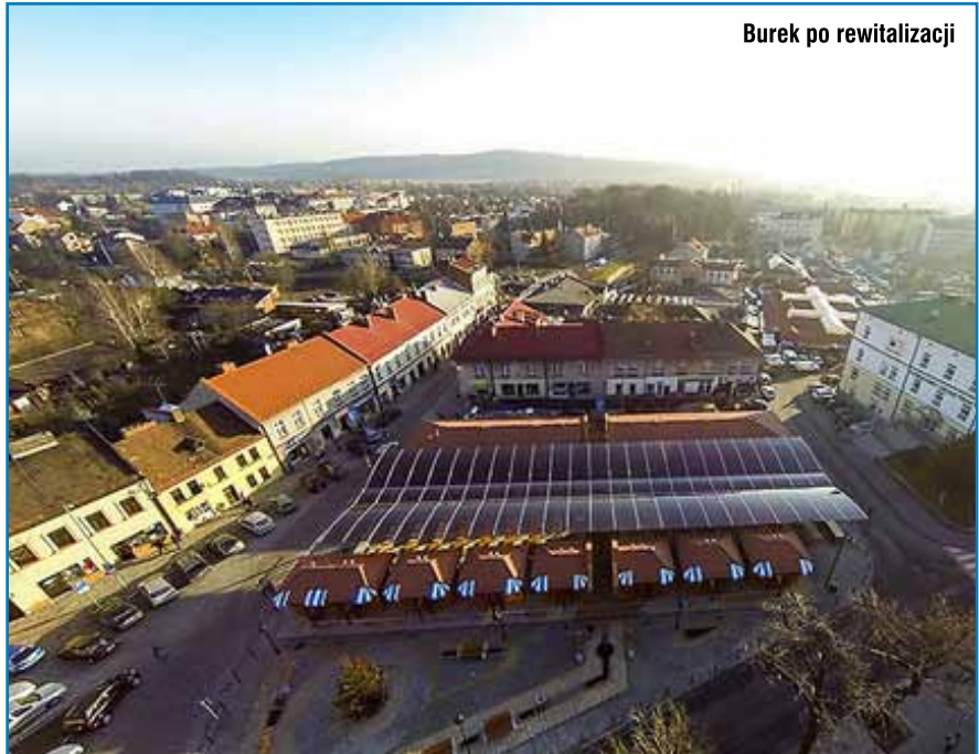
Burek po rewitalizacji