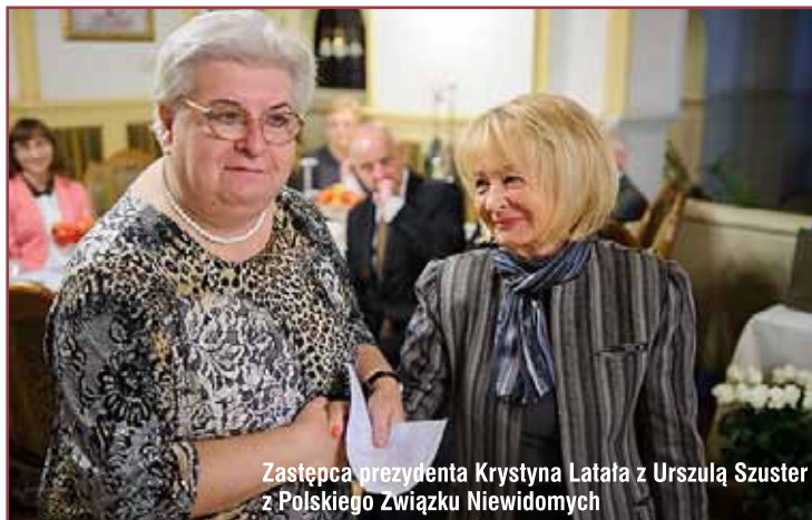
Zastępca prezidenta Krystyna Latała z Urszulą Szuster z Polskiego Związku Niewidomych

- Dzień Białej Laski jest doskonałą okazją do przypomnienia, że wśród nas żyją osoby niewidome, ale także okazją do wyrażenia wdzięczności wobec wolontariuszy, którzy na codzień pochylają się nad ich problemami i pomagają im - mówi zastępca prezidenta Krystyna Latała.