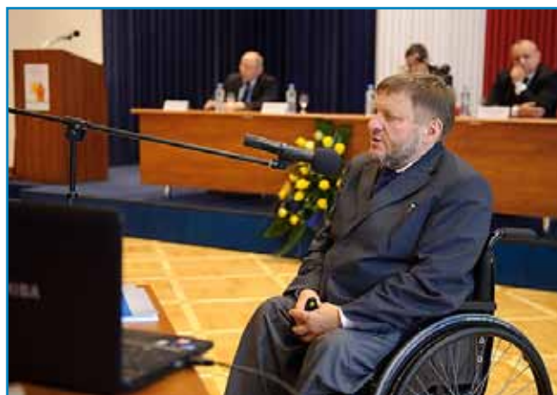
Jednym z gości konferencji był poseł Sławomir Piechota