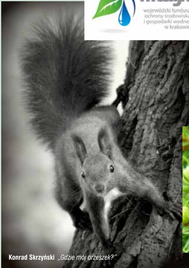
Konrad Skrzyński „Gdzie mój orzeszek?”