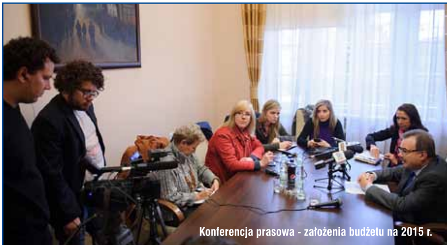
Konferencja prasowa - założenia budżetu na 2015 r.

Prace nad projektem budżetu muszą się zakończyć do połowy listopada. Po tym terminie będą go analizować radni. W następnej kolejności odbędzie się głosowanie.