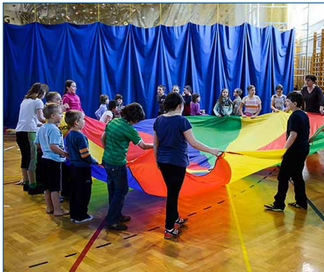
W ubiegłym roku oferta zajęć feryjnych cieszyła się dużą popularnością

27.02.2015 godz. 10.00-14.00 Hala Sportowa Pałacu Młodzieży w Tarnowie ul. Gumniska tel. 14 622 03 85