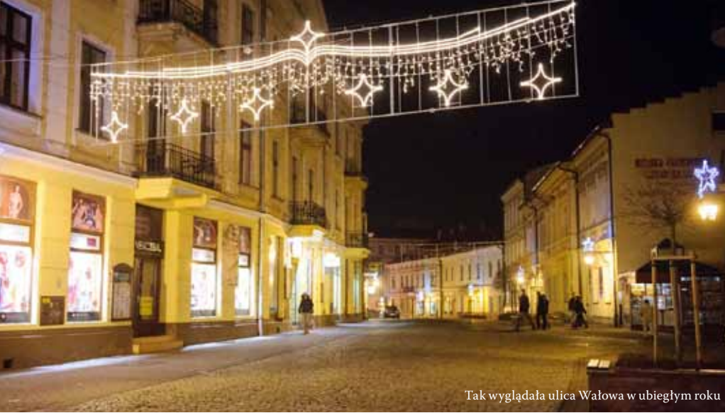
Tak wyglądała ulica Wałowa w ubiegłym roku