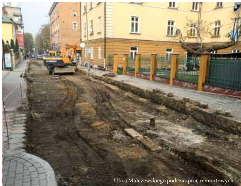
Ulica Malczewskiego podczas prac remontowych

W połowie grudnia ma się zakończyć remont drugiej połowy mostu na ul. Narutowicza. Pierwszą część obiektu oddano do użytku na początku listopada. Przypomnijmy, że na re-