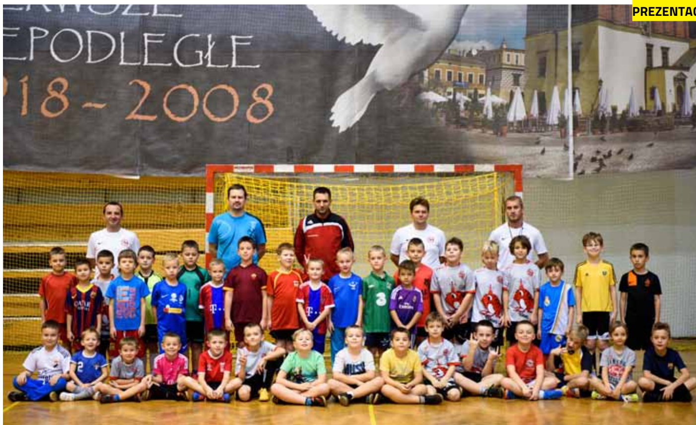
Na zdjęciu piłkarze z roczników 2007, 2008 i młodsi