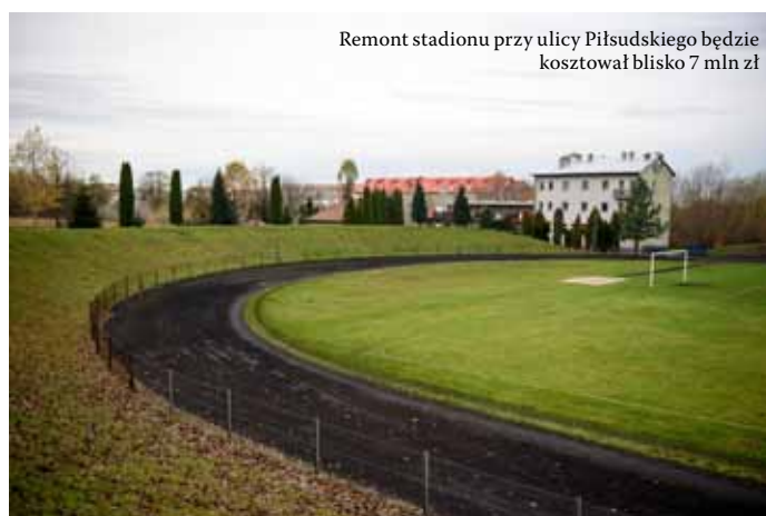
Remont stadionu przy ulicy Piłsudskiego będzie kosztował blisko 7 mln zł