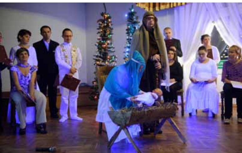
Inscenizacja podczas zeszłorocznego spotkania oplatkowego Warsztatów Terapii Zajęciowej przy Specjalnym Ośrodku Szkolno-Wychowawczym w Tarnowie.