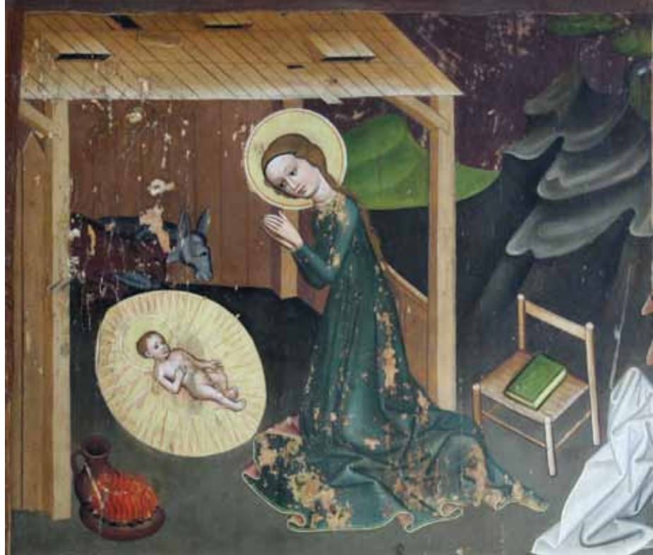
Boże Narodzenie, kwatera tryptyku z Ptaszkowej, ok. 1440 r., Muzeum Diecezjalne w Tarnowie.

Wśród polskich zabytków gotyckiego malarstwa wykazujących zależność od wizji św. Brygidy, i to jednym z najpiękniejszych tego przykładów, jest kwatera ołtarza z Ptaszkowej wykonana przez malarza szkoły sądeckiej, który przedstawił Dziewiczą Matkę i Jej Syna opro-