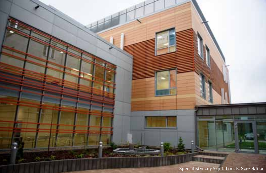
Specjalistyczny Szpital im. E. Szczeklika