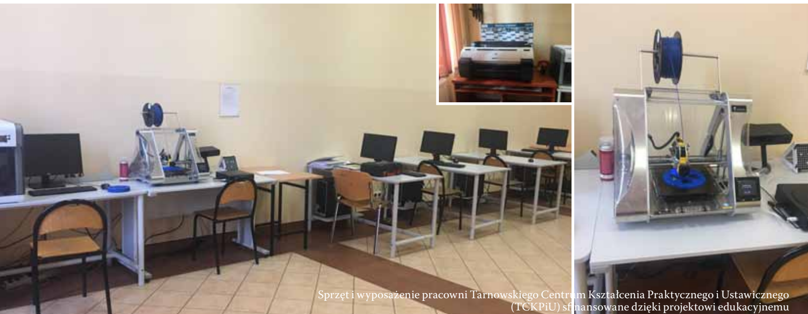
Sprzęt i wyposażenie pracowni Tarnowskiego Centrum Kształcenia Praktycznego i Ustawicznego (TCKPiU) sfinansowane dzięki projektowi edukacyjnemu