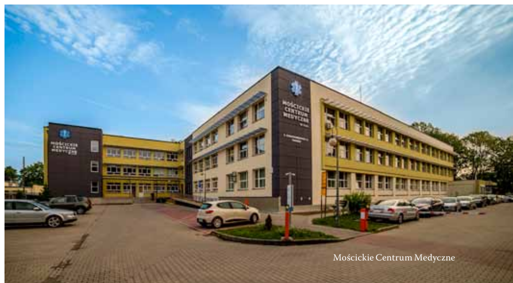
Mościckie Centrum Medyczne

Każdy, kto do nas przychodzi podkreśla, że Mościckie Centrum Medyczne jest nie do poznania, że wchodzi się do pięknej placówki, zupełnie innej niż wcześniej. Modernizacja stworzyła znacznie lepsze warunki przede wszystkim dla pacjentów rozbudowanego i unowocześnionego Zakładu Opiekuńczo – Leczniczego, Podstawowej Opieki Medycznej, gabinetów specjalistycznych i medycyny pracy. Te zmiany – mam tu na myśli choćby wyposażenie, klimatyzację wentylację mechaniczną, estetyczny i przyjazny wygląd pomieszczeń – podniosły też komfort pracy personelu medycznego i samopoczucie pacjentów. A przecież samopoczucie, psychika, odgrywają w procesie leczenia ogromną rolę. Chciałbym też podkreślić, że udało się rozwiązać sprawy niewralgiczne – zniknął problem z parkingiem, a dzięki zwiększeniu zatrudnienia lekarzy praktycznie nie ma kolejek w POZ.