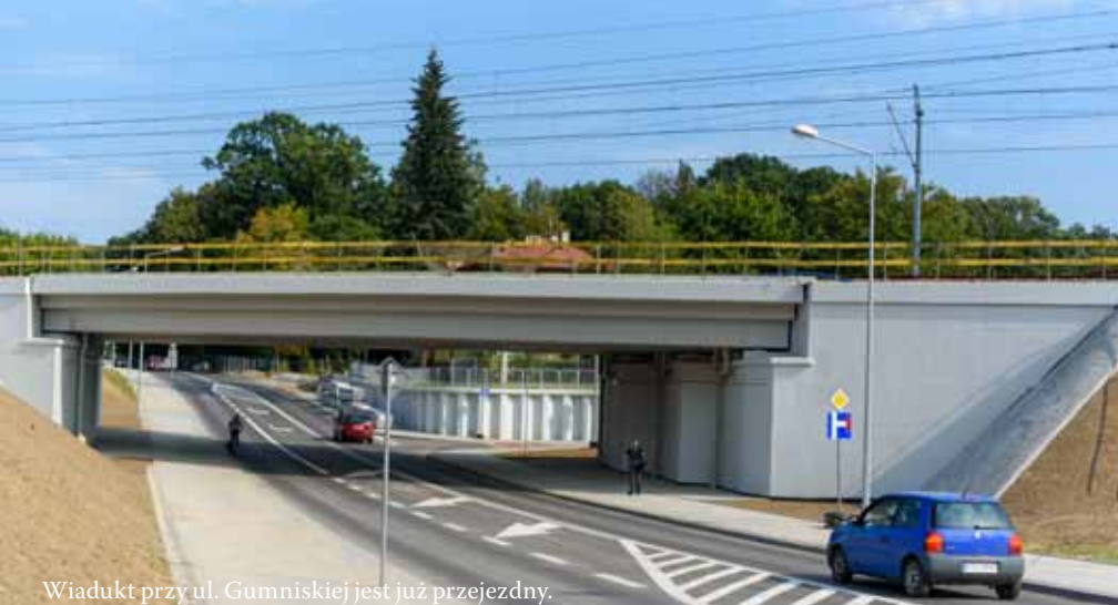
Wiadukt przy ul. Gumniskiej jest już przejezdny.