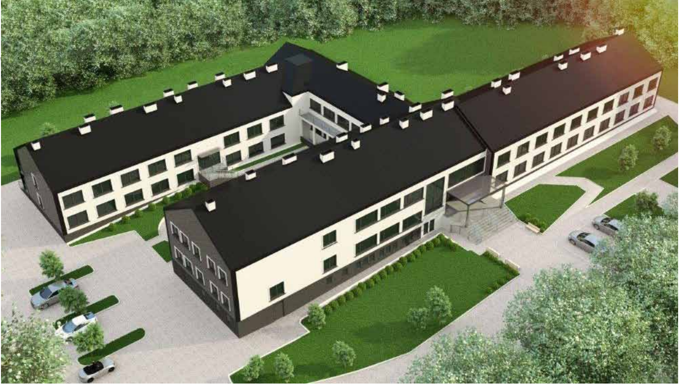
Już w październiku otwarte zostanie „Słoneczne Wzgórze”.