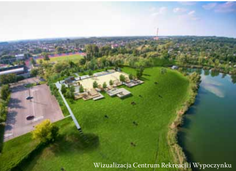
Wizualizacja Centrum Rekreacji i Wypoczynku