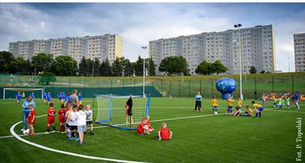
Kompleks sportowy przy ul. Wojska Polskiego