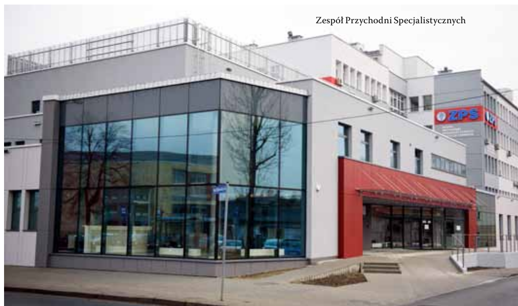
Zespół Przychodni Specjalistycznych

Widać, jak się szpital się zmienia. Zmienia się zresztą nadal - konsekwentnie poprawiamy jakość usług, zmieniamy warunki leczenia, bo w liczącym 180 lat szpitalu jeszcze niedawno nie były one zadowalające. Dzisiaj to szpital, który spokojnie może konkurować także z placówkami zagranicznymi. Wiemy to od pacjentów, którzy przebywali w innych szpitalach, w tym również od osób przyjeżdżających z zagranicy, które leczyły się w szpitalach Zachodniej Europy. Wystawiają nam dobre opinie i to jest bardzo miłe. Na takim właśnie poziomie chcemy leczyć ludzi, chcemy, żeby to było miejsce przyjazne zarówno dla pacjentów, jak i dla pracowników. W szpitalu pracuje ponad 900 osób, ważne jest, żeby im także stworzyć zadowalające warunki pracy, nie tylko od strony finansowej, ale także socjalnej, bezpieczeństwa czy jakości stosowanych materiałów medycznych. To przekłada się również na efekty leczenia, komfort pobytu i zadowolenie pacjentów.