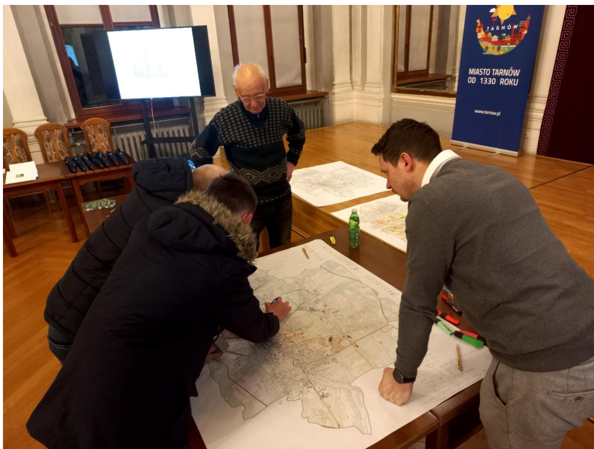
Zdjęcie 4 Dyskusja w ramach warsztatów społecznych