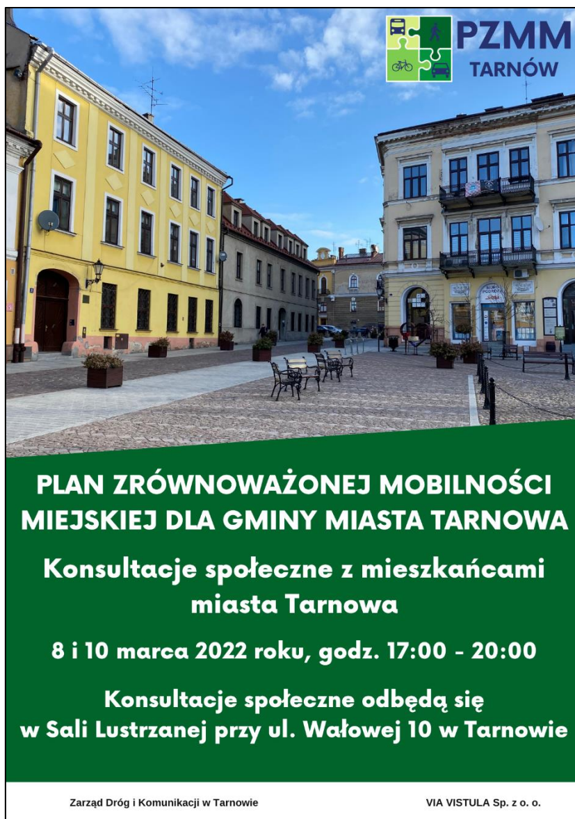
Rysunek 2 Jeden z plakatów informujących o realizowanych konsultacjach dokumentu

Istotność uczestnictwa mieszkańców w działaniach związanych z planem była istotna od samego początku opracowywania dokumentu, dlatego na potrzeby projektu stworzono logo będące elementem identyfikacji wizualnej projektu. Dodatkowo skupiono się na informowaniu mieszkańców o działaniach i projekcie w środkach masowego przekazu, w tym głównie w kanałach informacyjnych on-line, z wykorzystaniem platformy Facebook® oraz stron internetowych Tarnowa www.tarnow.pl .