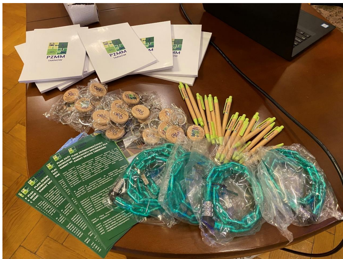
Zdjęcie 3 Gadżety przygotowane na potrzebę konsultacji społecznych