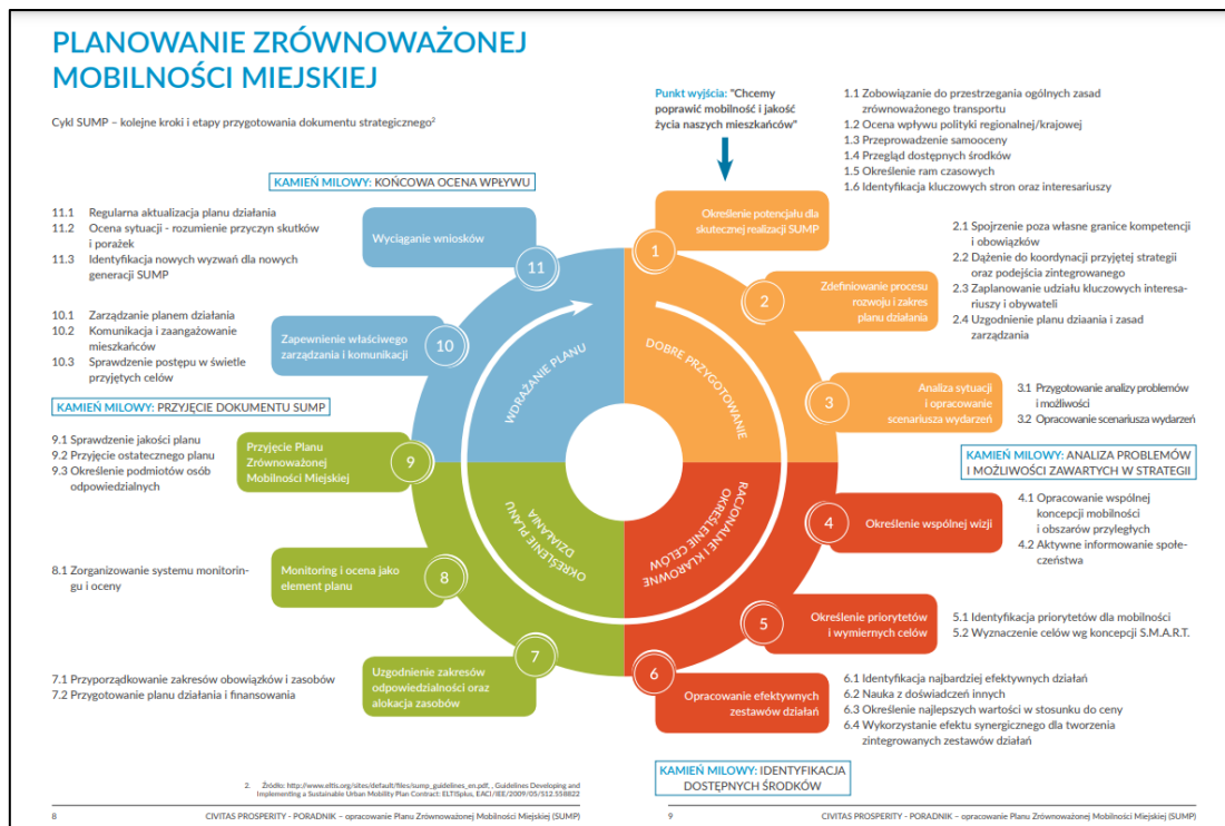
Rysunek 1 Wytyczne do planowania zrównoważonej mobilności miejskiej