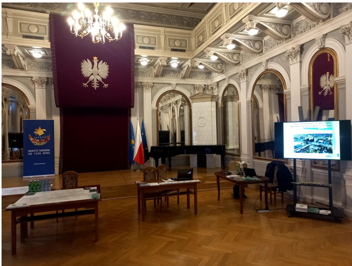
Zdjęcie 2 Materiały konsultacyjne w Sali Lustrzanej w Tarnowie