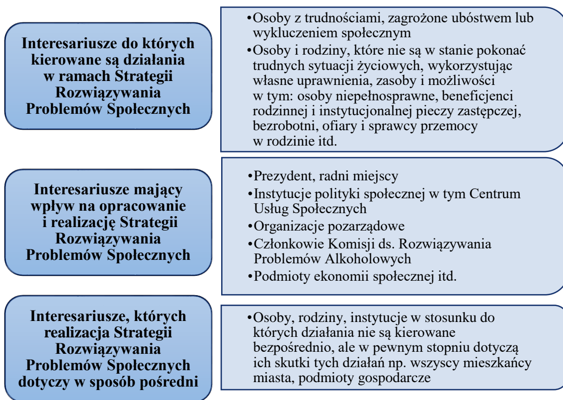
Rysunek nr 4 Interesariusze Strategii Rozwiązywania Problemów Społecznych