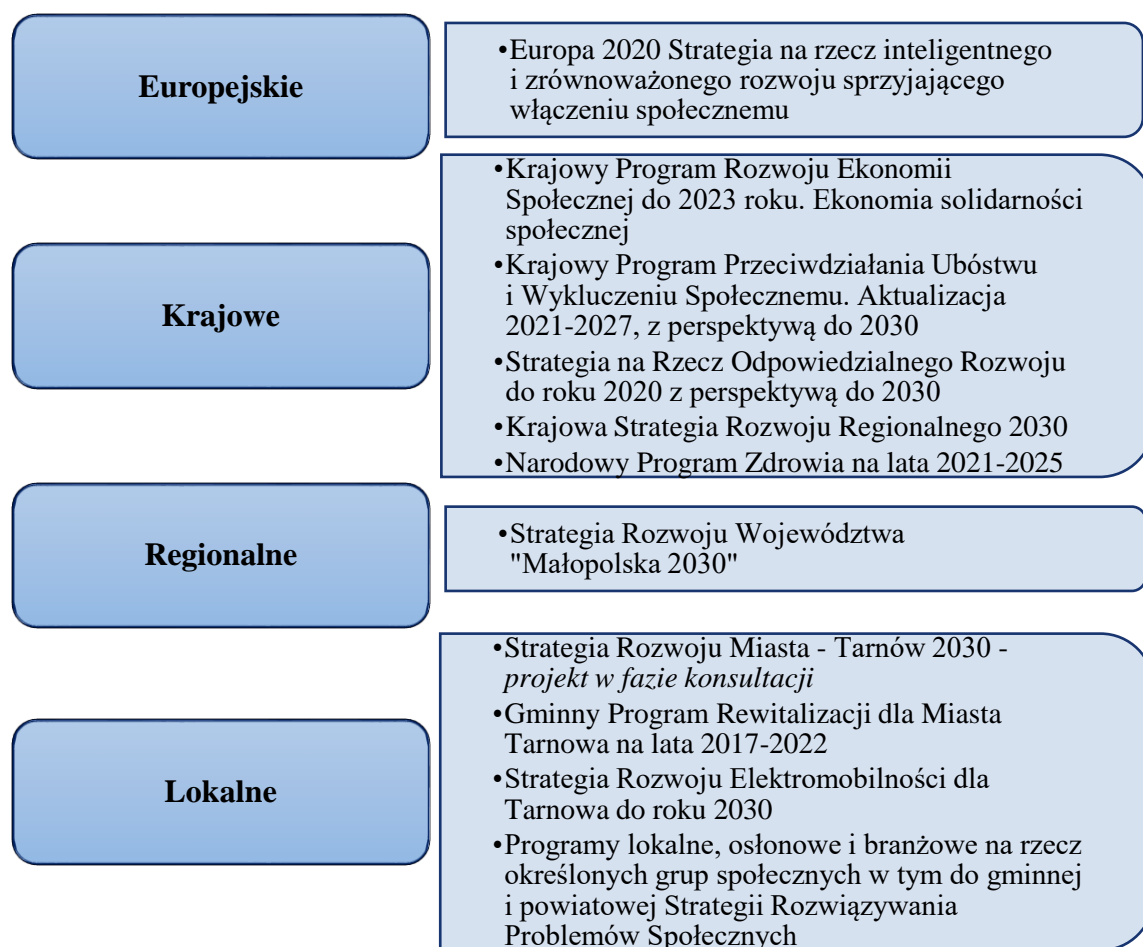
Rysunek nr 3 Dokumenty strategiczne w systematyce Strategii Rozwiązywania Problemów Społecznych