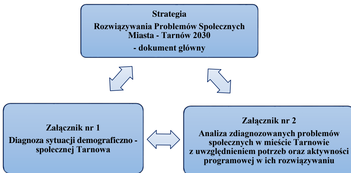
Rysunek nr 1 Struktura Strategii Rozwiązywania Problemów Społecznych Miasta - Tarnów 2030

Na Strategię Rozwiązywania Problemów Społecznych Miasta - Tarnów 2030 składa się trzy dokumenty.