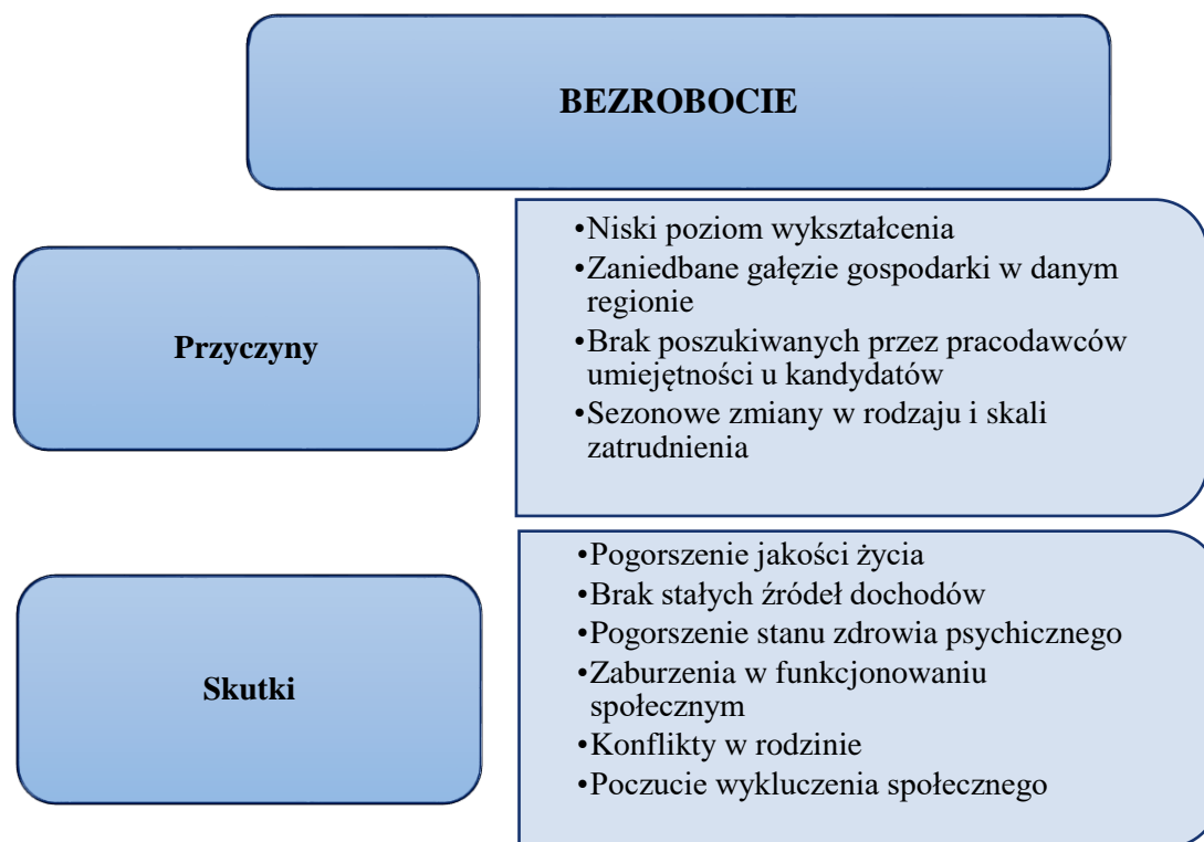
Rysunek nr 4 Przyczyny i skutki bezrobocia wśród tarnowian