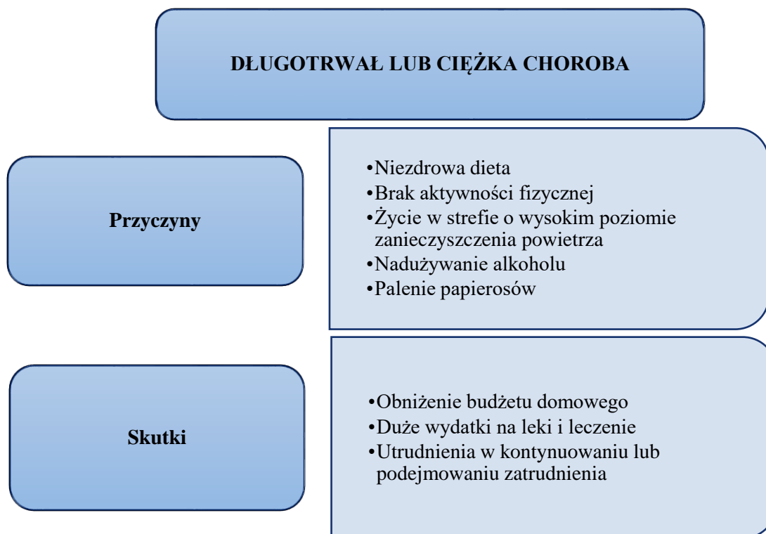
Rysunek nr 2 Przyczyny i skutki długotrwałej lub ciężkiej choroby wśród tarnowian