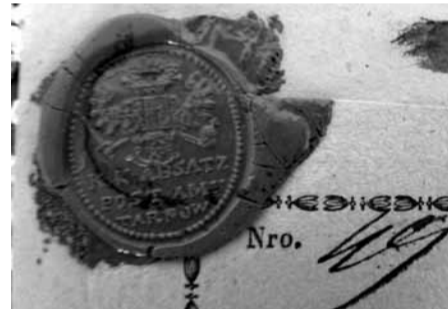
Odcisk lakowy stempla poczty austriackiej w Tarnowie z XIX w.