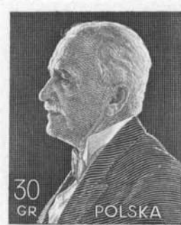
Znaczek z 1938 r. Prezydent RP Ignacy Mościcki, twórca Mościc i Zakładów Azotowych