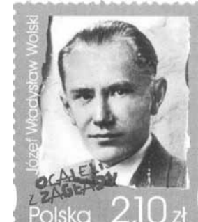
Urodzony w Tarnowie wybitny historyk, prof. UJ, (znaczek z 2009 r.)