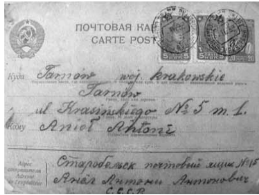
Kartka do mieszkańca Tarnowa z obozu jeńców polskich w Starobielsku (1940)

Obecny jubileusz jest znakomitą okazją do podsumowań. Przez szeregi PZF w Oddziale, a następnie Okręgu w Tarnowie przevinęło się łącznie kilkanaście tysięcy osób, w tym bardzo duża grupa uczniów wielu szkół w Tarnowie i mniejszych miejscowościach. To jest jedna z miar niedocenionego znaczenia filatelistyki jako sposobu poznawania wiedzy o świecie i ludziach. Przeszkolono w ciągu tych lat kilka tysięcy uczniów oraz dużą grupę nauczycieli. Zorganizowano kilkadziesiąt wystaw i blisko 200 pokazów filatelistycznych, podczas których zwiedzający – znów wiele tysięcy osób – mieli okazję poznać mniej znane uroki świata i wielką wiedzę fachową wystawców. Opracowano wiele materiałów w postaci katalogów, palmaresów, informatorów, wreszcie plakatów, zaproszeń, czy dyplomów, które są dzisiaj nie tylko zwykłymi, ale w wielu wypadkach niezwykle cennymi pamiątkami. Tarnowscy filatelisci zdobyli kilkaset medali, w tym na największych wystawach filatelistycznych na świecie. Można je porównać z mistrzostwami świata, albo igrzyskami olimpijskimi. I nawet jeśli nie mamy tak bardzo utytułowanych mistrzów, jak inne ośrodki w Polsce, to przecież powinniśmy być dumni z tego typu osiągnięć mieszkańców Tarnowa, czy Dębicy.