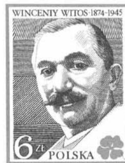
Znaczek z 1984 r. z podobizną trzykrotnego premiera RP, pochodzącego z Wierchosławic