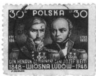
1948 r.; ciekawostka: na znaczku błędna data ur. gen. Bema - 1795