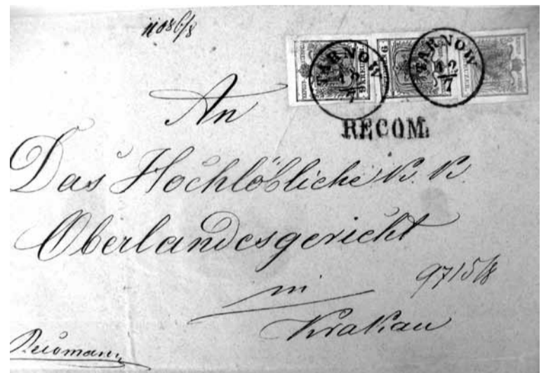
List polecony nadany w Tarnowie w pol. XIX w. ze znaczkami poczty austriackiej