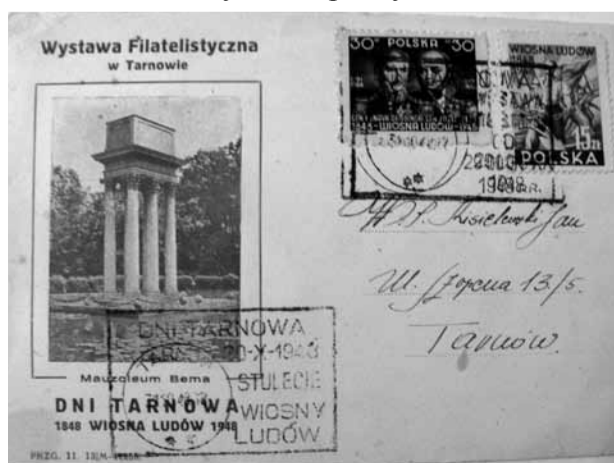
Kartka pocztowa z okazji Wystawy Filatelistycznej „Dni Tarnowa” (1948)

W 1935 roku powstał w Tarnowie Klub Filatelistów, który był pierwszym formalnie organizującym filatelistów stowarzyszeniem kolekcjonerskim w mieście i okolicy. Tarnowski Klub przyłączył się do wydawania, wspólnie z Lwowskim Towarzystwem Filatelistów, Śląskim Stowarzyszeniem Filatelistów i Kołomyjskim Klubem Filatelistów „Ilustrowanego Kuriera Filatelistycznego”, który ukazywał się od 1924 roku. „Kurier” ukazywał się jako miesięcznik w objętości ośmiu stron, na których mieściły się bieżące informacje filatelistyczne, a także specjalistyczne opracowania historyczne, a także oficjalne wystąpienia do Dyrekcji Poczty i Telegrafów w Krakowie, np. w sprawie używania przez urzędy pocztowe Tarnów 2 i Mościce k. Tarnowa zatłuszczonych kasowników i rozlewającego się tuszu do kasowania znaczków pocztowych na przesyłkach, co powodowało niezadowolenie szczególnie zagranicznych odbiorców tych przesyłek.