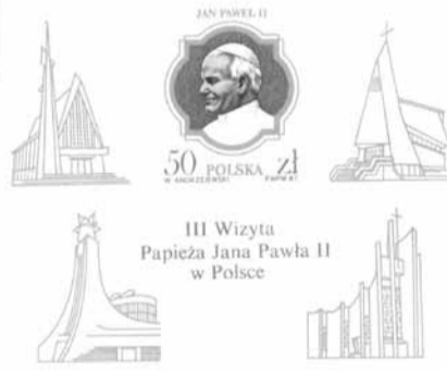
1987 r.; w lewym górnym rogu bryła kościoła MB Fatimskiej