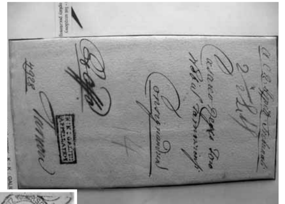
Najstarszy znany list tarnowski z 1791 roku