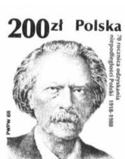
Kompozytor, pianista i polityk, związany z Kąsną Dolną