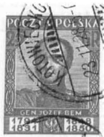
1928 r. - z okazji sprowadzenia do Tarnowa prochów gen. Bema