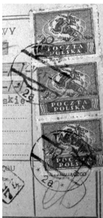
Falszywe znaczki wykonane w Tarnowie w 1921 r.