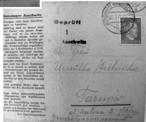
Kartka z KL Auschwitz do mieszkanki Tarnowa z 1944 roku