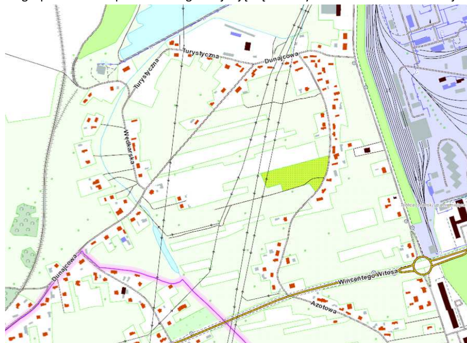
Rys. 1 - Obszar opracowania

Obszar znajduje się w północno-zachodniej części miasta Tarnowa. I ograniczony jest ulicami Chemiczną, Dunajcowa, granica miasta oraz Witosa. Dominującym typem zabudowy jest zabudowa mieszkaniowa - tradycyjne domy jednorodzinne wraz z towarzyszącymi im zabudowaniami gospodarskimi, przy głównych ciągach komunikacyjnych lokalizują się obiekty produkcyjno-usługowe. W bezpośrednim sąsiedztwie terenu objętego opracowywaną zmianą miejscowego planu zagospodarowania przestrzennego znajdują się Zakłady Azotowe oraz rzeka Dunajec.