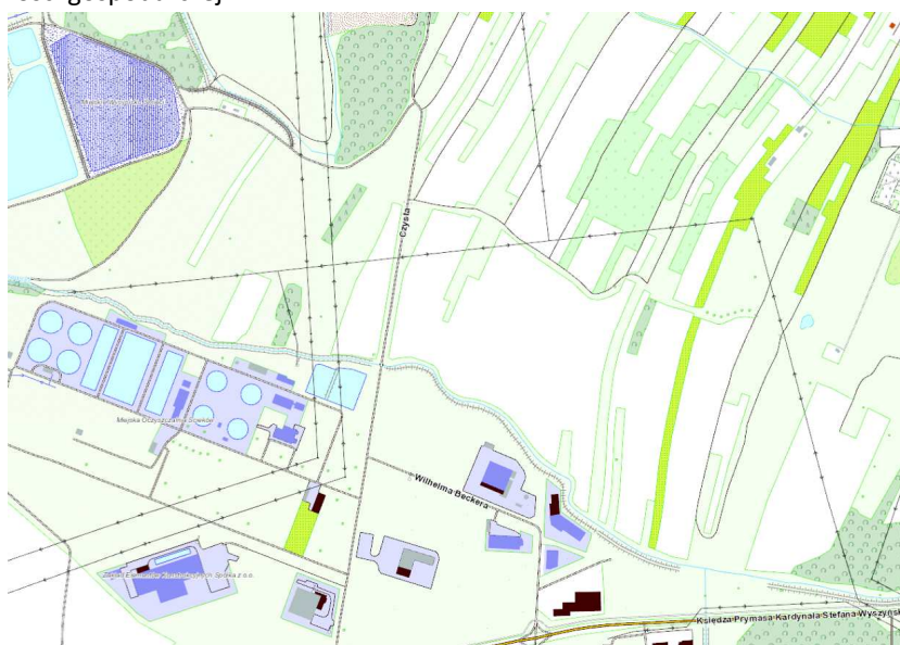
Rys. 1 - Obszar opracowania

Obszar znajduje się w północno-zachodniej części miasta Tarnowa. I ograniczony jest od południa rowem Chyszowskim a od północy ciekim powierzchniowym „bez nazwy”. W stanie istniejącym obszar jest niezurbanizowany, z dominującym zagospodarowaniem rolnym i łąkami. W bezpośrednim sąsiedztwie terenu objętego opracowywaną zmianą miejscowego planu zagospodarowania przestrzennego znajdują się osadniki Zakładów Azotowych, oczyszczalnia ścieków i klaster aktywności gospodarczej.