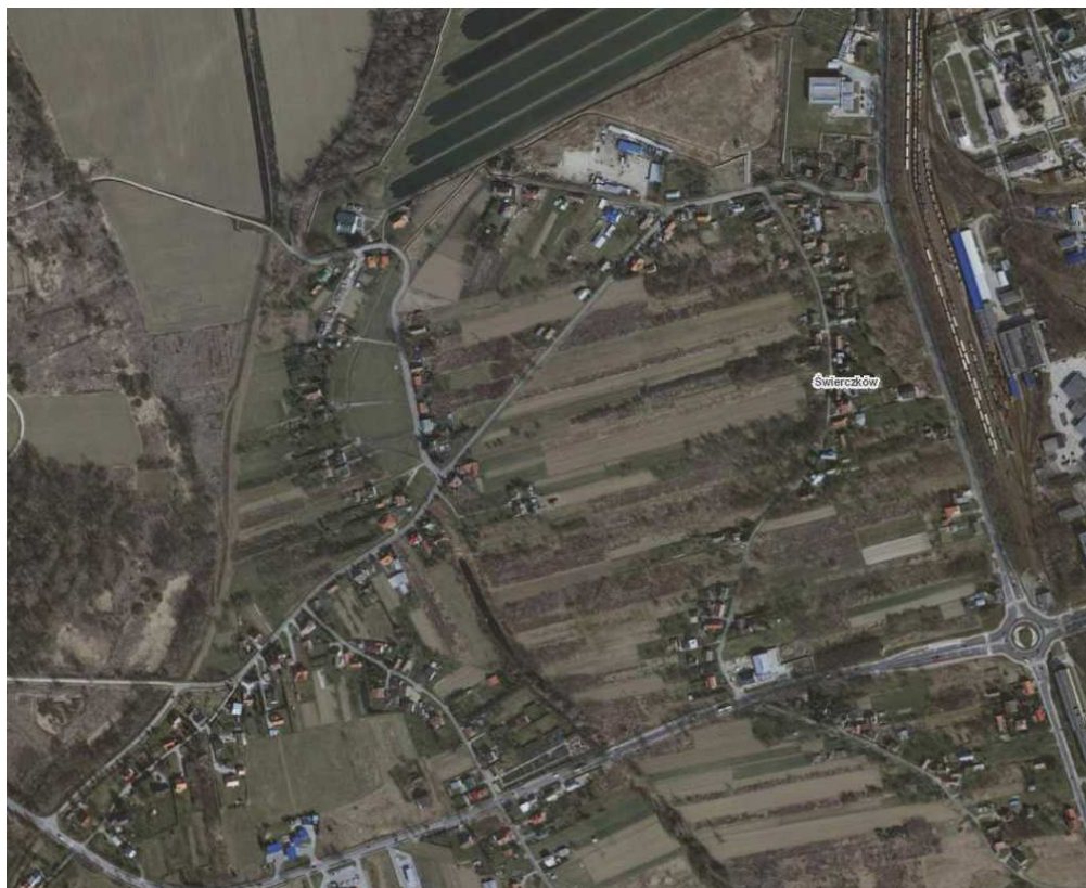
Rys. 2 - Obszar opracowania