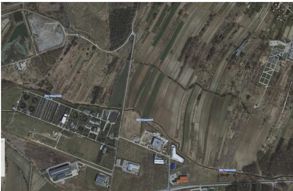
Rys. 2 - Obszar opracowania