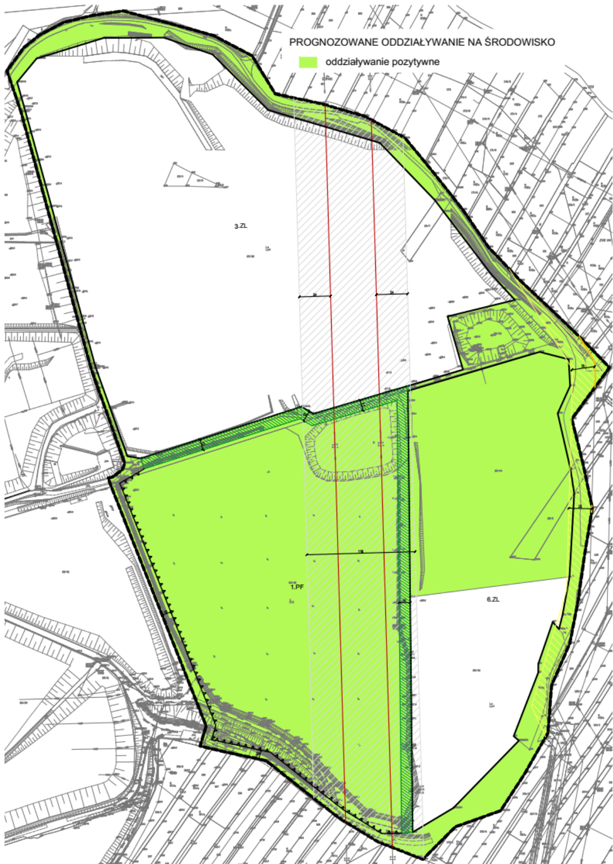
Rysunek 2 Oddziaływanie projektu zmiany planu na środowisko – schemat nr 2