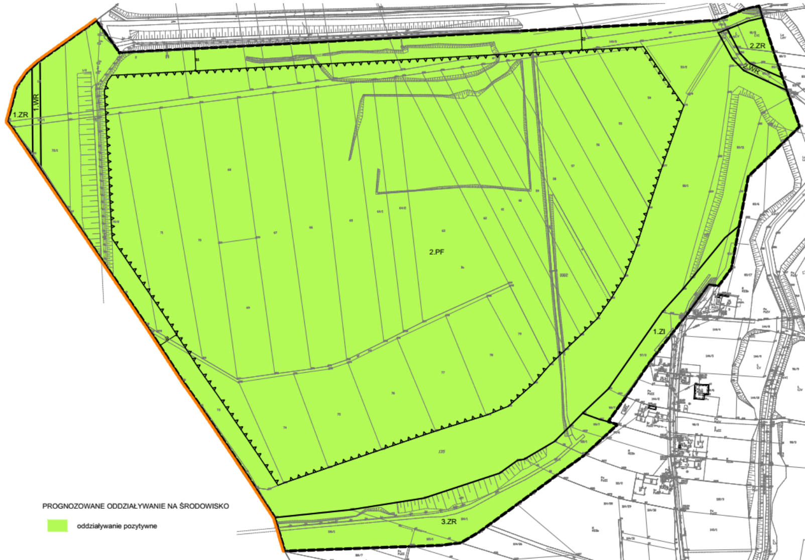
Rysunek 3 Oddziaływanie projektu zmiany planu na środowisko – schemat nr 3