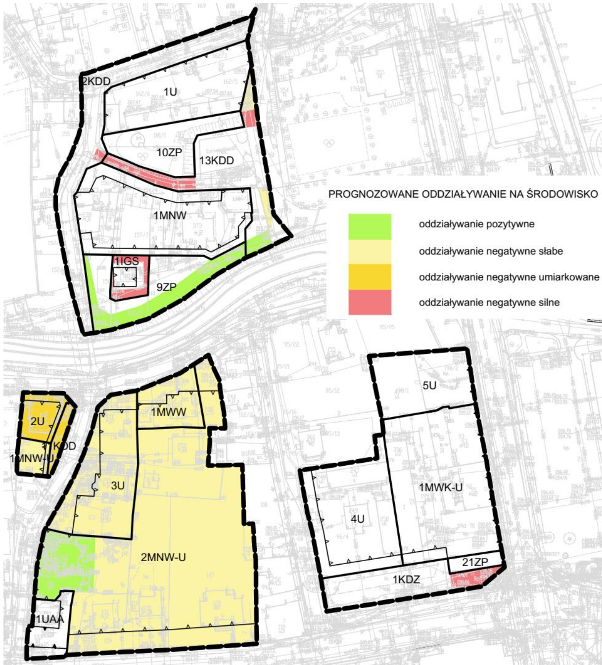
Rysunek 2 Oddziaływanie projektu zmiany planu na środowisko – schemat nr 1