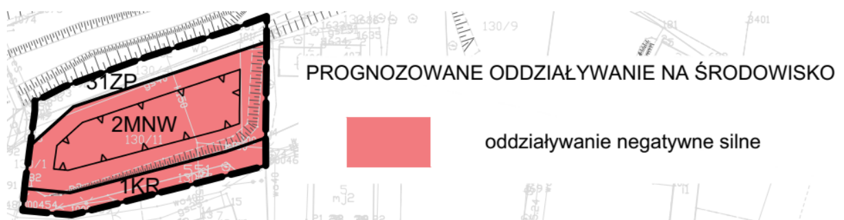
Rysunek 4 Oddziaływanie projektu zmiany planu na środowisko – schemat nr 3