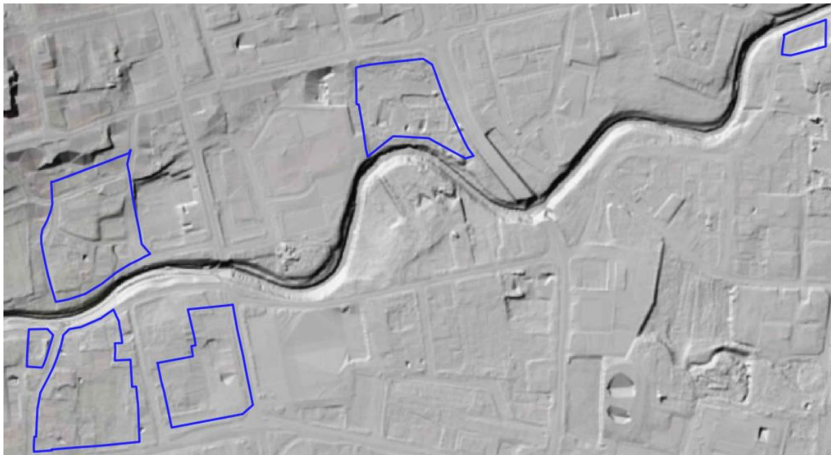
Rysunek 1 Rzeźba terenu na obszarze opracowania ( opracowanie własne na podstawie www.geoportal.gov.pl )

Obszar opracowania jest dość zróżnicowany pod kątem ukształtowania terenu. Lokalne deniwelacje występują na terenie przy ul. Jagiellońskiej. Ponadto Młyn Szancera jest położony w obniżeniu terenowym względem sąsiedztwa, natomiast teren przy ul. Franciszkańskiej jest położony nieznacznie powyżej terenów sąsiadujących z nim od południa.